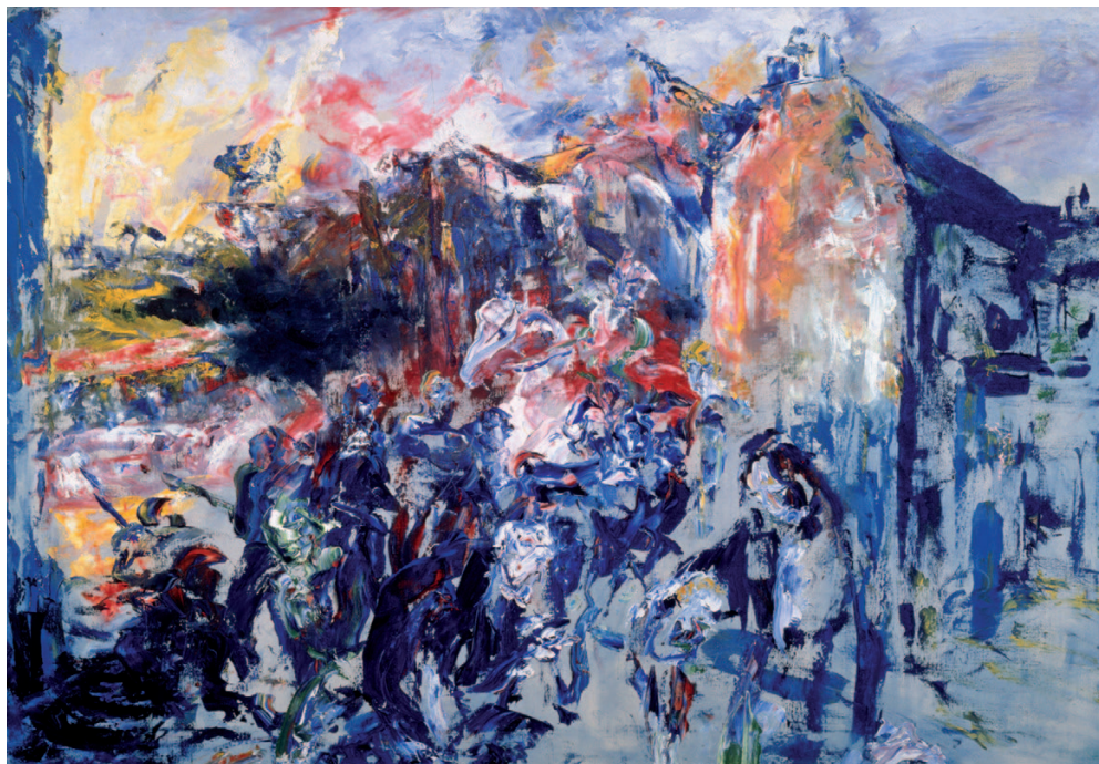
Fíor 1.7 GRIEF ( Dobrón), Jack B. Yeats, Gailearaí Náisiúnta na hÉireann, Baile Átha Cliath

Spreagadh capail samhlaíocht Yeats. Chuir siad a óige i Sligeach agus an tsaoirse a bhain leis an tréimhse sin i gcuimhne dó. Feictear arís agus arís eile ina chuid saothar iad. De réir mar a tháinig forbairt ar a stíl phéintéireachta, d'éirigh leis gluaiseacht a chur in iúl go cumasach.