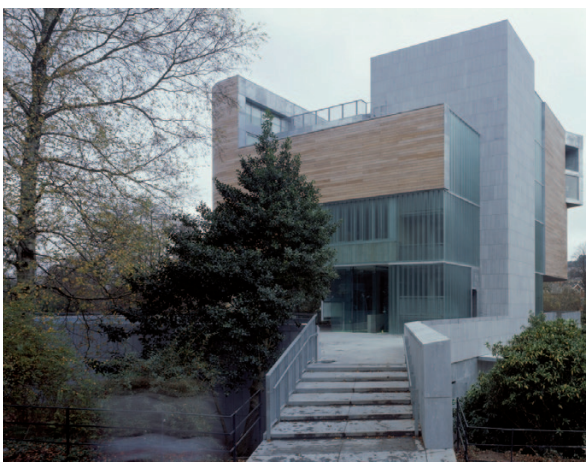
FIOR 1.25 Gailearaí Lewis Glucksman, Coláiste na hOllscoile, Corcaigh