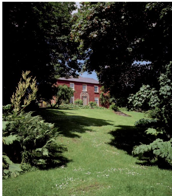
Fíor 1.27 Teach Gléibe, Co. Dhún na nGall

Tógadh an teach i ré na Leasríochta agus maisíodh é le troscán na linne agus le páipéar balla a dhear William Morris.