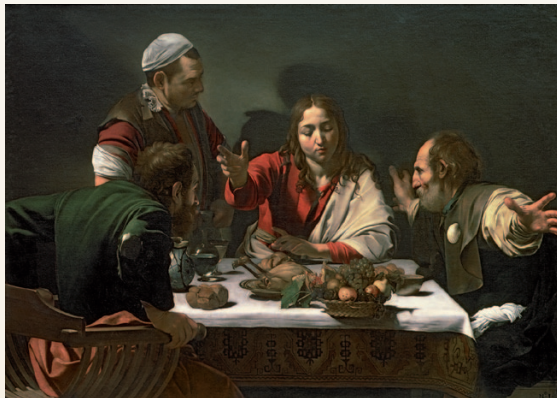
FÍOR 1.32 CENA IN EMMAUS ( Suípéar in Emmaus ), Caravaggio, An Gailearaí Náisiúnta, Londain