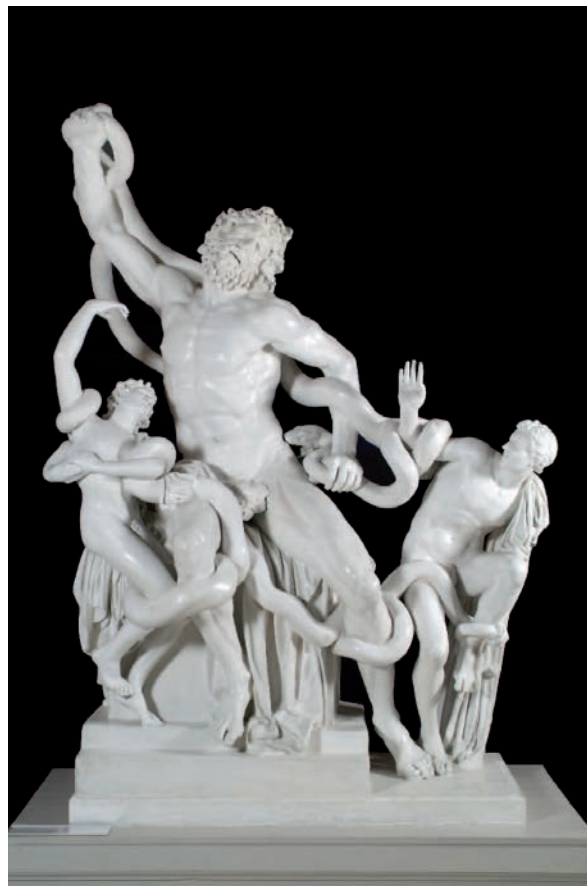
Fíor 1.21 GRUPPO DEL LAOCOONTE ( Laocoön agus a Chlann Mhac ), Gailearaí Ealaíne Crawford, Co. Chorcaí

I croí an bhailiúcháin tá foireann speisialta de dhealbha Gréagacha agus Rómhánacha a tugadh go Corcaigh in 1818 ó Mhusaem na Vatacáine sa Róimh. Bronnadh na dealbha