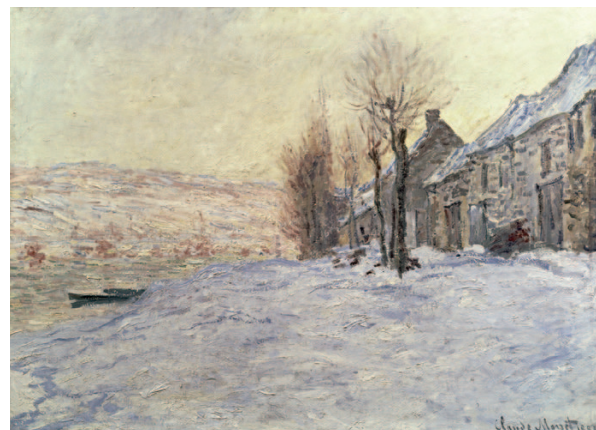
FIOR 1.19 LAVACOURT SOUS LA NEIGE ( Lavacourt faoi Bhrat Sneachta ), Claude Monet, Gailearaí Hugh Lane Chathair Bhaile Átha Cliath