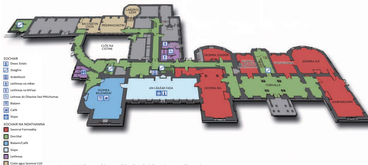
FIOR 1.28 Plean urlár na talún, Teach Fóite, Contae Chorcaí