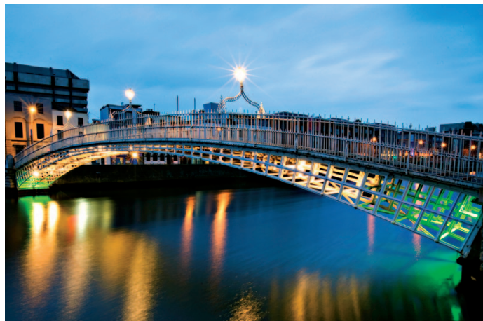
FIOR 1.11 Droichead na Leathphingine, Baile Átha Cliath

faoin tslí ar cheart an ghailearaí a leagan amach. Theastaigh ghailearaí nua-thógtha uaidh chun a chuid pictiúr impriseanaíoch a chur ar taispeáint go buan ann. Moladh dearáí éagsúla i láithreacha éagsúla, ina measc sin bhí láthair ar Fhaiche Stiabhna. Ach ba é an ceann ab fhearr leis féin, agus leis an mBantiarna Gregory agus eile, ná dearadh foirgnimh a rinne an t-aitire ó Londain, Edward Lutyens (fíor 1.10). Droichead a bheadh san fhoirgneamh agus bhí sé le dul trasna Abhainn na Life in áit Dhroichead na Leathphingine (fíor 1.11).