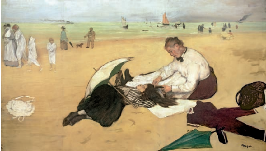
FIOR 1.17 SUR LA PLAGE ( Ar an Trá ), Edgar Degas, Gailearaí Hugh Lane Chathair Bhaile Átha Cliath