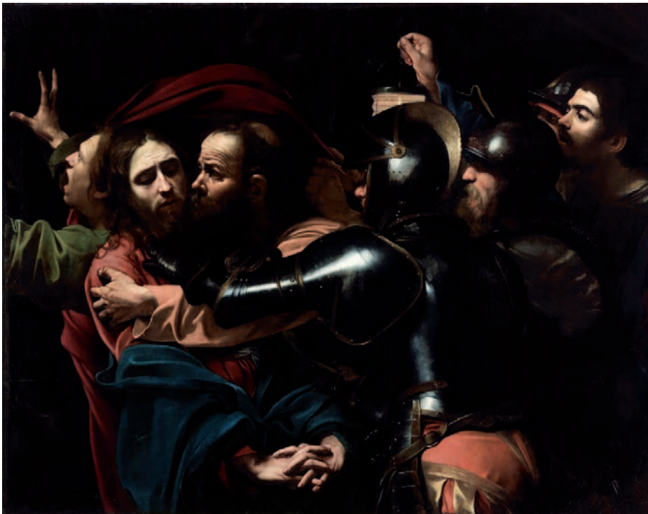
Flór 1.3 LA CATTURA DI CRIOSTO ( Gabháil Chríost ), Caravaggio, Gailearaí Náisiúnta na hÉireann, Baile Átha Cliath

Baineann pictiúir le scoileanna difriúla péintéireachta. Ar an gcéad fhéachaint, d'fhéadfadh sé sin mearbhall a chur ort. Ach tar éis tamaill, gheobhaidh tú tuiscint ar na foirmeacha agus ar na seánraí éagsúla i bpéintéireacht iarthar na hEorpa, agus ar na comhthéacsanna a bhain lena bhforbairt thar na céadta bliain.