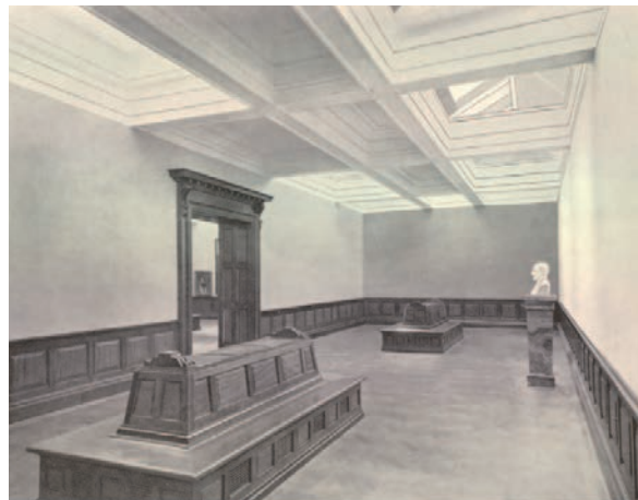
FIGOR 1.13 An 'seomra folamh' i nGailearaí na Cathrach

Fuair Bardas Bhaile Átha Cliath cabhair ó mhórán daoine sna hiarrachtaí a rinne siad chun na pictiúir a fháil ar ais. I measc na ndaoine sin bhí an péintéir Sarah Purser, bean a bhunaigh eagraíocht ar tugadh Friends of the National Collections uirthi in 1924, agus an Bhantiarna Gregory. D'oibrigh an Bhantiarna Gregory go dícheallach ar son na cúise; lorg sí cabhair ó gach duine a bhí báúil leis an gcúis, an ceannaire aontachtach sa Tuaisceart, Edward Carson, agus Éamon de Valera ina measc. In 1932 bhronn an rialtas Teach Charlemont i gCearnóg Pharnell ar chathair Bhaile Átha Cliath chun Gailearaí na Cathrach a chur ann. Ba é Teach Charlemont an teach cathrach a bhí ag James Caulfield, an chéad Iarla Charlemont,