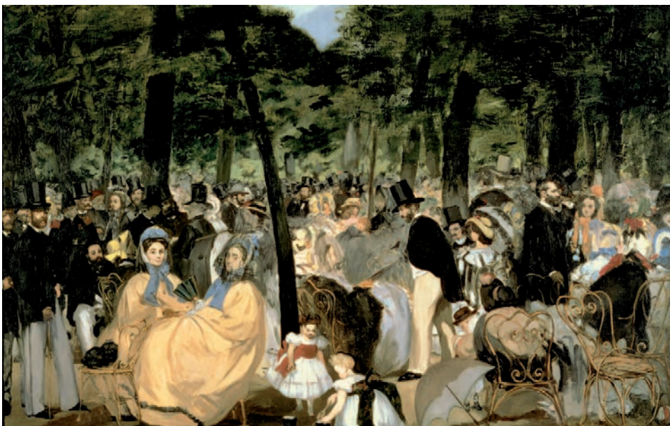
FÍOR 1.15 LA MUSIQUE AUX TUILERIES ( An Ceol ag Tuileries ), Édouard Manet, An Gailearaí Náisiúnta, Londain