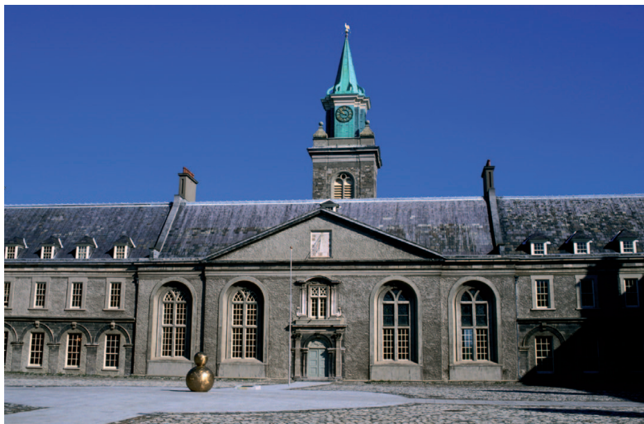
Fíor 1.9 Áras Nua-Ealaíne na hÉireann, Ospidéal Ríoga Chill Mhaighneann, Baile Átha Cliath

rabhtas ag iarraidh aird a tharraingt orthu sa taispeántas. Dúirt sí ag an am gurbh iad na healaíontóirí sin 'an rún is mó in Éirinn nár scaoileadh'. Dúirt sí nach raibh an t-aitheantas céanna acu is a bhí ag lucht litríochta nó ag lucht ceoil na tíre agus 'gurbh í bunaidhm an taispeántais ná feachtas a chothú i dtaobh na healaíne comhaimseartha agus í a chur os comhair an phobail ionas go bhféadfaí taitneamh a bhaint aisti agus tuiscint a fháil uirthi.'