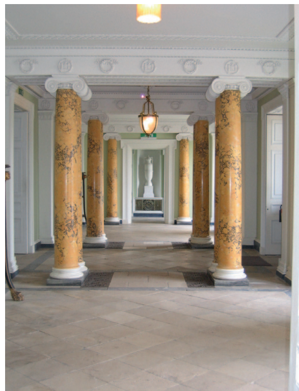
Fíor 1.30 An forhalla, Teach Fóite, Co. Chorcaí

Mar nach féidir le dearthóirí agus le lucht pleanála taispeántais na ballaí ná na landaí a bhogadh go heasca i dTeach Fóite. Ní mór taispeántais a dhearadh de réir leagan amach an tí, ar spás taispeántais é cheana féin. Ní mór leithead na bpasáistí (fíor 1.30) agus leithead na seomraí (fíor 1.31) a chur san áireamh