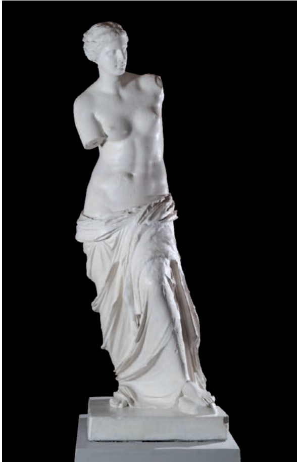
FIOR 1.22 VENUS DI MELOS ( Venus, nó Aphrodite, as Melos ) Gailearaí Ealaíne Crawford, Co. Chorcaí

ar Chumann Ealaíon Chorcaí. Múnlaí bána plástair de na bundealbha marmair is ea iad. San áireamh sin tá Gruppo del Laocoön ( Laocoön agus a Chlann Mhac ) (fíor 1.21) agus Venus di Melos ( Venus, nó Aphrodite, as Melos ) (fíor 1.22) chomh maith le dealbha de lúthchleasaithe na Gréige. Tá siad ar taispeáint ar urlár na talún i ngailearaí mór a bhfuil dath dúdhearg ar na ballaí agus solas bog nádúrtha ann.