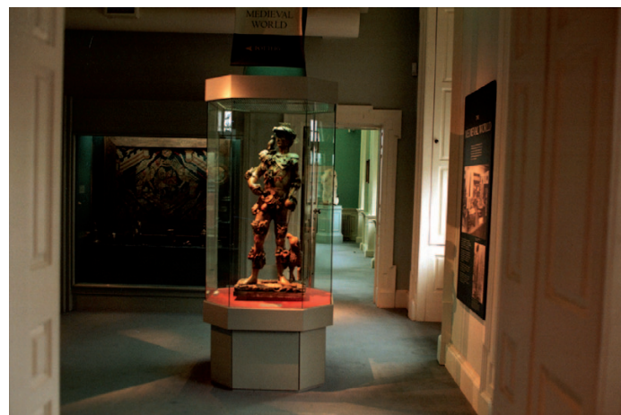
FIOR 1.26 Músaem Hunt, Cathair Luimnigh