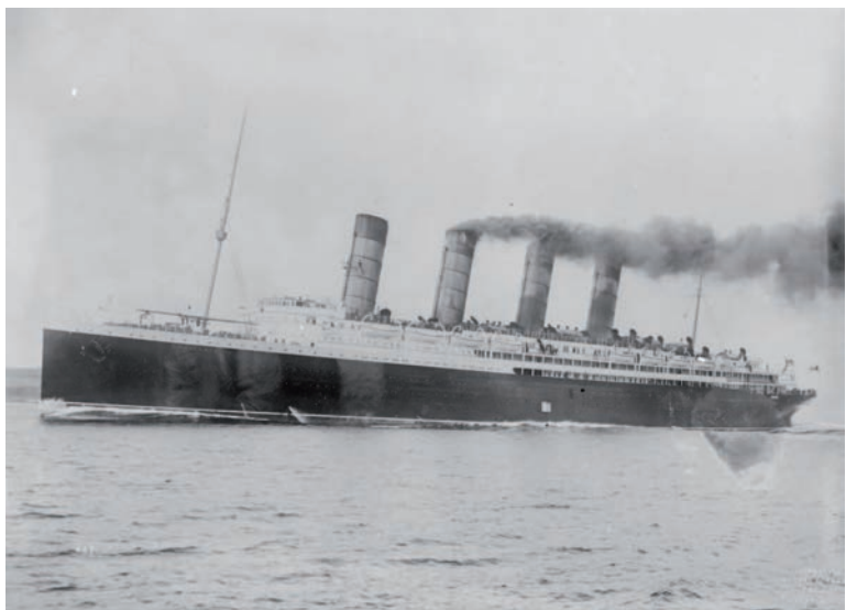
Fíor 1.20 An Lusitania

Bhí Hugh Lane ina stiúrthóir ar Ghailearaí Náisiúnta na Éireann ó 1914 go dtí go bhfuair sé bás in 1915 agus d'fhág sé cuid dá mhórshaibhreas le huacht ag an nGailearaí. Go dtí an lá atá inniu ann, cuireann Ciste Lane cúnamh airgid ar fáil chun saothair ealaíne a cheannach don Ghailearaí Náisiúnta.