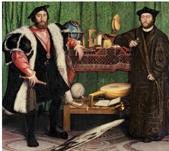
FIGOR 1.1 THE AMBASSADORS (Na hAmbasadóirí), Hans Holbein, An Gailearaí Náisiúnta, Londain