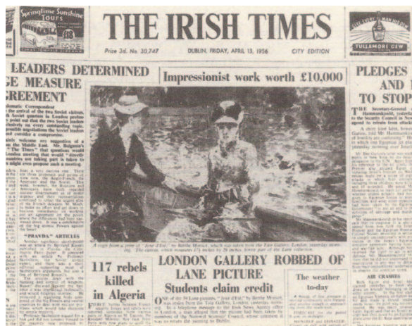
FIGOR 1.14 Leathanach tosaigh an Irish Times ar an Aoine, 13 Aibreán 1956

Chuala beirt mhac léinn (duine díobh a bhí ina bhall den IRA) an scéal faoin seomra folamh in 1956 agus shocraigh siad go bhfaighidís na pictiúir ar ais d'Éirinn. D'éirigh leo ceann de na pictiúir a ghoideadh i lár an lae ó Gailearaí Tate, i Londain. Ba é an pictiúr ná Jour d'Été le Berthe Morisot ( Lá Samhraidh ). Bhí an eachtra i gceannlínte na nuachtán (fíor 1.14) ach thóg sé tamall fada sular tugadh na pictiúir ar ais go dleathach.