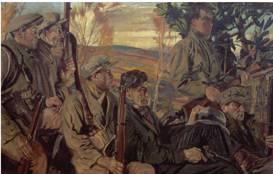
FIOR 1.24 MEN OF THE SOUTH ( Fir an Deiscirt ) Seán Keating, Gailearaí Ealaíne Crawford, Co. Chorcaí