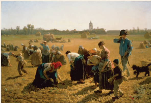
FÍOR 1.33 LES GLANEUSES ( Na Díolamóirí ), Jules Breton, Gailearaí Náisiúnta na hÉireann, Baile Átha Cliath