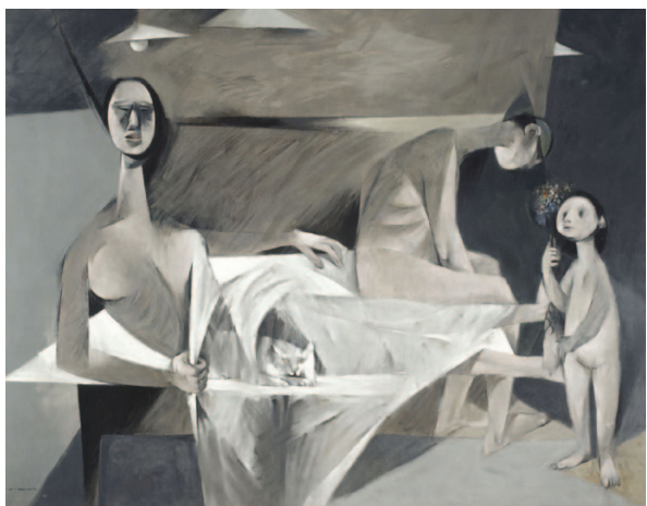
FÍOR 1.5 A FAMILY ( Teaghlach), Louis le Brocquy, 1951, olaphéint ar chanbhás, 147 x 185 cm, bailiúchán Ghailearaí Náisiúnta na hÉireann, Baile Átha Cliath