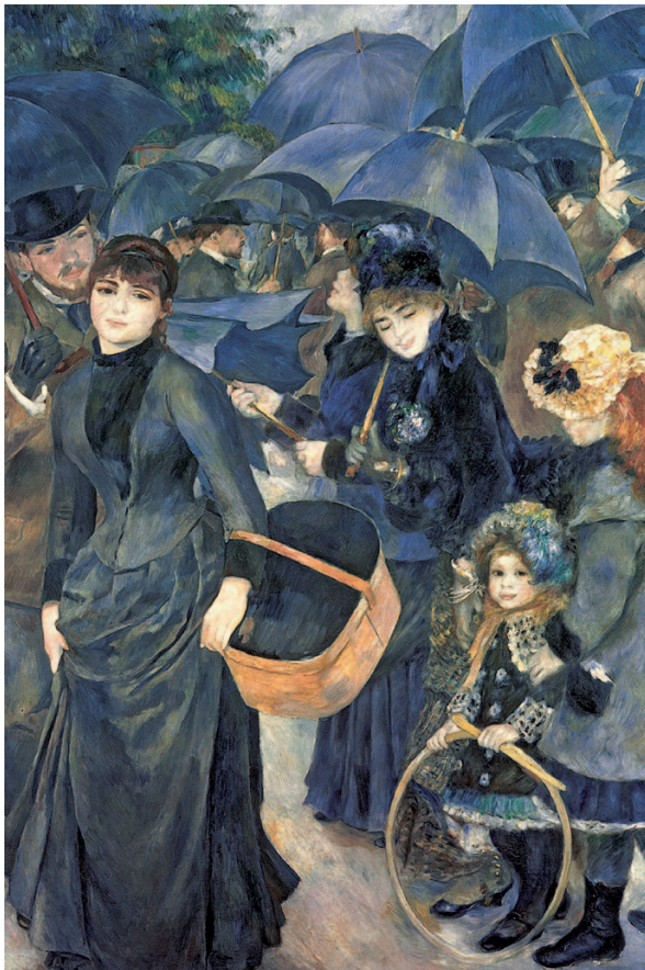
FIOR 1.18 LES PARAPLUIES ( Na Scáthanna Báistí ), Pierre-Auguste Renoir, An Gailearaí Náisiúnta, Londain