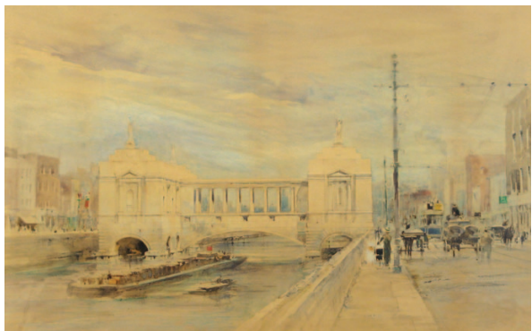
FIOR 1.10 Dearadh le Edwin Lutyens de Ghailearaí na Cathrach a rachadh trasna na Life (Ghailearaí Hugh Lane Chathair Bhaile Átha Cliath)

D'éirigh le Lane brú a chur ar Bhordas Bhaile Átha Cliath foirgneamh a aimsiú ar Shráid Fhearchair a bheadh oiriúnach don ghailearaí. Bhí tuairimí thar a bheith láidir ag Lane