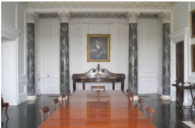
Fíor 1.31 An seomra bia, Teach Fóite, Co. Chorcaí

chomh maith sa mhéid is go bhféadfadh sé a bheith deacair ag an bpobal a mbealach a dhéanamh timpeall. Bíonn cuid acu beag nó róchúng agus bíonn sé deacair teacht ar chuid acu. Cuireadh ardaitheoir isteach i dTeach Fóite le déanaí ionas go mbeidh sé níos fusa ag gach cuairteoir, agus go háirithe ag daoine i gcathaoir rothaí, dul isteach sa teach.