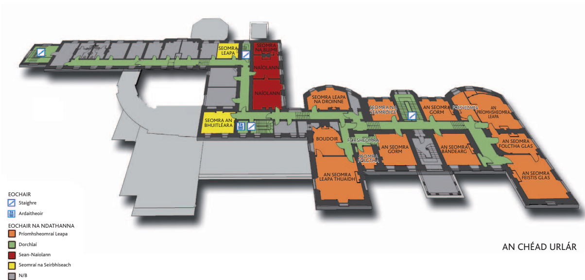
Fíor 1.29 Plean an chéad urláir, Teach Fóite, Contae Chorcaí