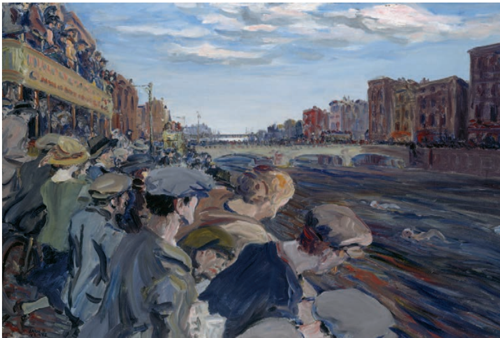
Fíor 1.6 THE LIFFEY SWIM ( Snámh na Life), Jack B. Yeats, Gailearaí Náisiúnta na hÉireann, Baile Átha Cliath

d'aoinise (fíor 1.7). Tharla dhá chogadh domhanda le linn a shaoil, bhain Éirí Amach 1916, Cogadh na Saoirse agus an Cogadh Cathartha suaithheadh ollmhór as muintir na hÉireann, agus faoin am a rinne sé Dobrón , bhí a bhean ar shlí na fírinne chomh maith.