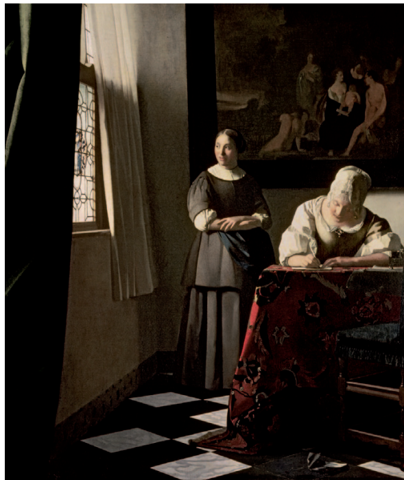
FÍOR 1.4 SCHRIJVENDE VROUW MET DIENSTBODE ( Bean Uasal ag Scríobh Litreach lena Banseirbhíseach ), Johannes Vermeer, Gailearaí Náisiúnta na hÉireann, Baile Átha Cliath

Tá an radharc suite i gcúinne seomra agus tá an solas ag teacht isteach trí fhuinneog ard ar an mballa ar chlé. Tá cuirtín fada dúghlas ar imeall clé an phictiúir, é tarraingthe siar mar a bheifí ag cur fáilte roimh dhuine teacht isteach. Tá bean ina suí ag bord ag scríobh litreach. Tá gúna bánghlas uirthi, muinchillí bána, caipín bán, agus fáinní cluaise péarla uirthi. Tá banseirbhíseach a bhfuil naprún gorm uirthi taobh thiar den bhean agus í ag féachaint amach an fhuinneog. Tá a dhá lámh trasna ar a chéile agus tá sí ag feitheamh leis an mbean atá gafa i scríobh na litreach. Tá urlár marmair sa seomra galánta agus tá sraith tileanna ar imeall an urláir. Ar an mballa cúil tá pictiúr mór i bhfráma éabainn a léiríonn scéal ón Sean-Tiomna faoin tslí ar thángthas ar Mhaois.