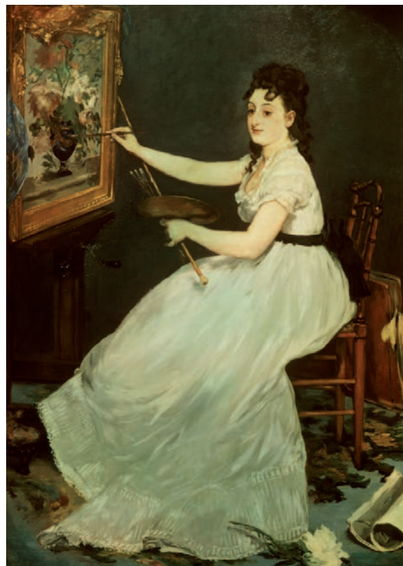
FÍOR 1.16 EVA GONZALÈS, Édouard Manet, An Gailearaí Náisiúnta, Londain

Measadh go raibh an pictiúr scannalach toisc go raibh géaga nochta mná le feiceáil ann. Fuair Gonzalès bás in 1883 agus í luí seoil cúpla lá i ndiaidh do Manet bás a fháil.