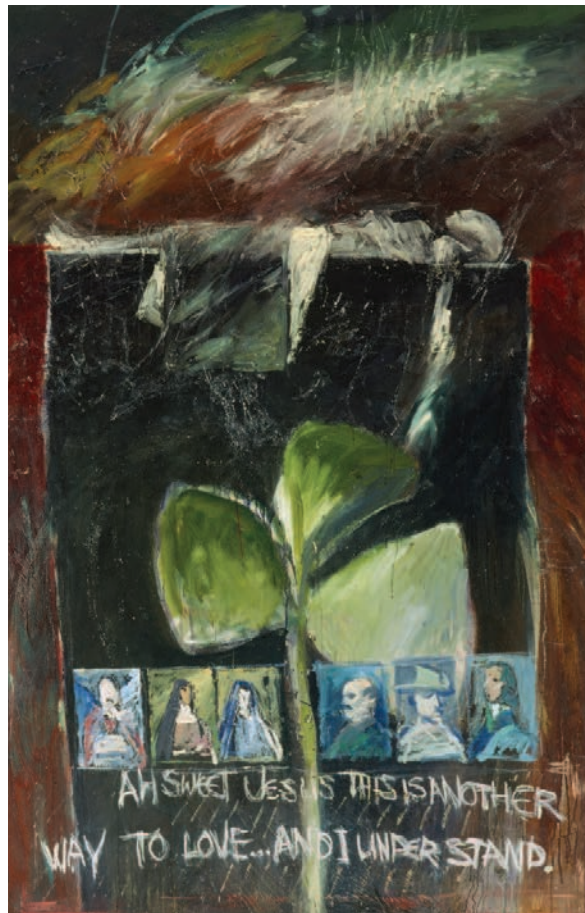
FIG 1.2 IRELAND III (Éire III), Patrick Graham, Gailearaí Hugh Lane Chathair Bhaile Átha Cliath

Téann ealaín mhacasamhlach réalaióch i bhfeidhm ar an intinn. Mura mbíonn eilimintí teibí sa cheapadóireacht bíonn an inchinn in ann brí an phictiúir a oibriú amach go furasta agus ní bhíonn an sásamh céanna le baint as.