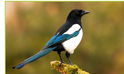
snag breac meaig míogadán breac

Is féidir ainmneacha na bplandaí agus na n-ainmhithe a fhiosrú ar na suíomhanna seo: