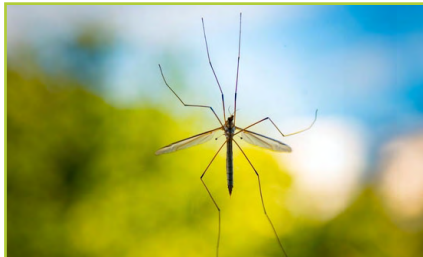
galán snáthaid an phúca tuirne Mháire daddy-long-legs