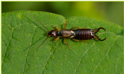
gailseach ceilpeadóir ciaróg lín Síle an phíce