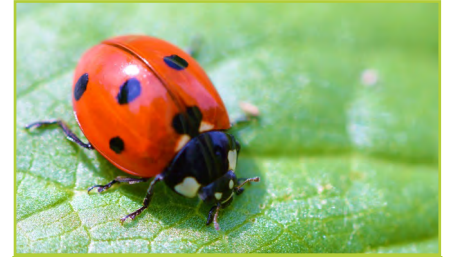
bóin Dé bó shamhraidh cearc Mhuire God's cow

Iarr ar na daltaí aon ainmneacha éagsúla atá acu a scríobh síos ina gcóipleabhar. Seo roinnt samplaí: