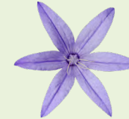
Bláth a bhfuil ó phiotal nó níos mó air