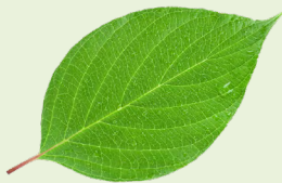
Duilleog atá níos mó ná do lámh