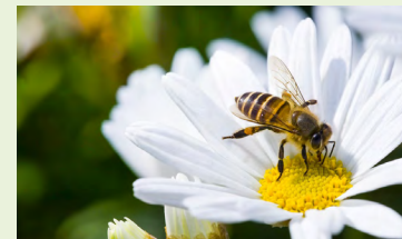
Beach ar bhláth