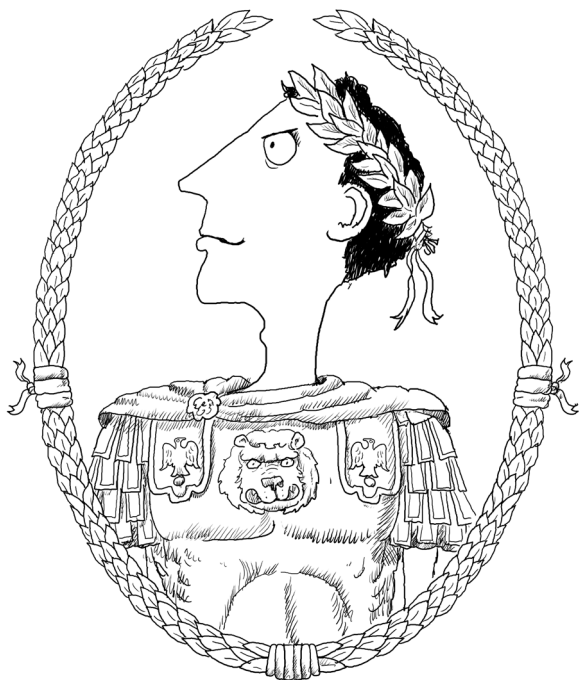
Manchán Maximus Laoch Mór de chuid na Róimhe 9

Cad a déarfá leis na scrollaí paipíre seo a thug Daid dom aréir? As seo amach tá sé i gceist agam gach rud a tharlaíonn dom a bhreacadh síos iontu. Ansin nuair a bheidh cáil orm mar laoch calma de chuid na hImpireachta, beidh eolas freisin ar mo chuid macghníomhartha ar fad.