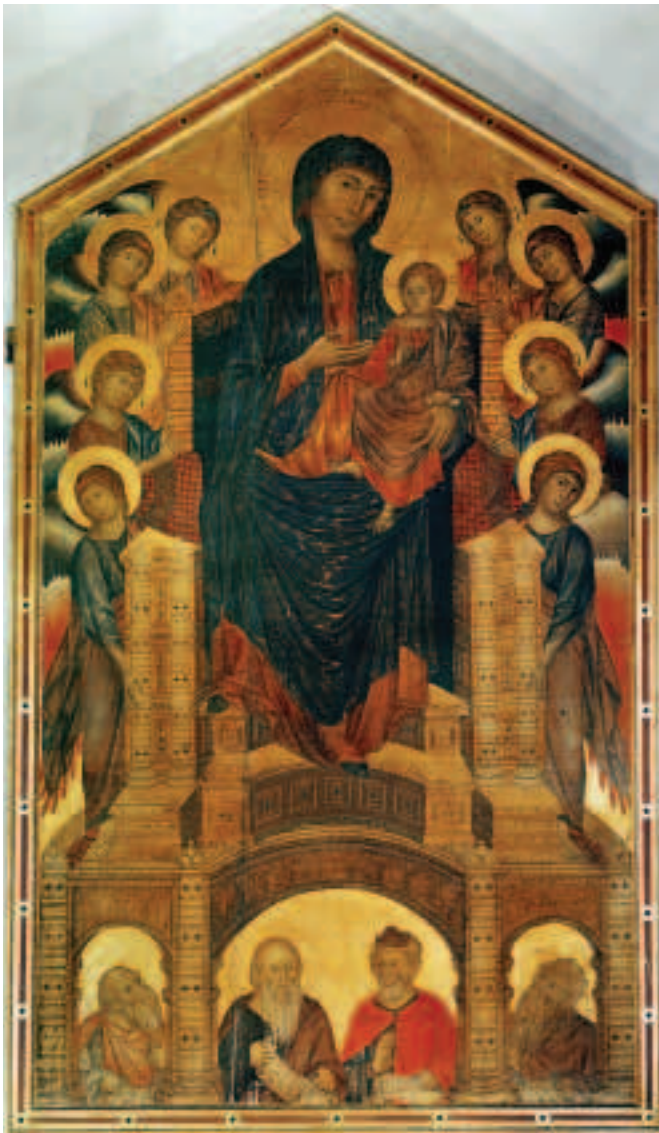
FIOR 19.4 MUIRE BANRÍON NA bhFLAITHEAS, Cimabue, Gailearáí Uffizi, Flórans