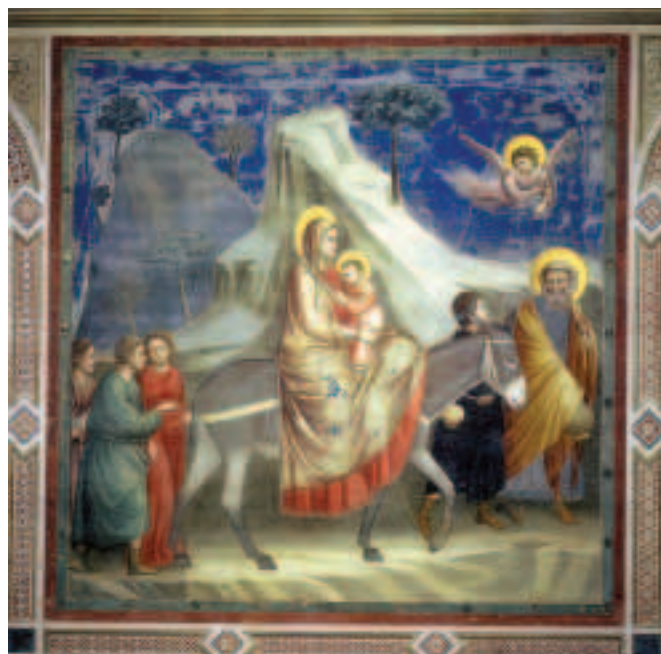
Fíor 19.9 AN TEITHEADH SAN ÉIGIPT, Giotto di Bondone, Cappella degli Scrovegni, Padova na hIodáile

Mheiltí na clocha chun péint a dhéanamh a bhí chomh geal gorm sin go raibh cuma leamh ar dhathanna eile i gcomparáid léi. Ní fhéadtaí teacht ar an gcloch ach amháin i ngarbchríocha na hAfganastáine, agus, siocair sin, bhí costas an-mhór uirthi. Mar gheall air sin, ba ghnách d'ealaíontóirí praghas an datha ghoirm sin a lua leis féin mar chostas breise.