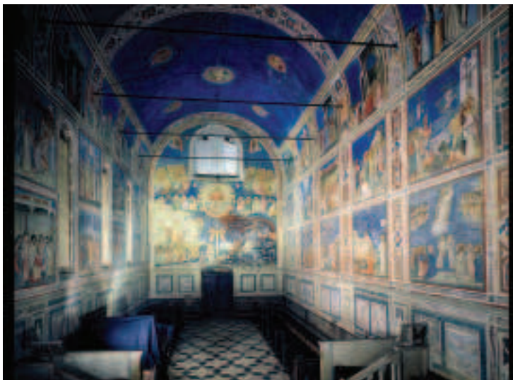
FIOR 19.5 An taobh istigh de Cappella degli Scrovegni, ag amharc ar AN BREITHIÚNAS DEIRIDH