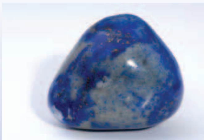
Fíor 19.10 Lapis lazuli

Bhí idir rachmas agus tionchar ag muintir Scrovegni, agus, tar éis na hoibre uile a rinne Giotto dóibh siúd, bhí buanéileamh ann ar a chuid seirbhísí ag pátrúin eile neamhchléireacha. Choimisiúnaigh muintir Peruzzi agus Bardi, teaghlaigh rachmasacha baincéireachta de chuid Fhlórans é chun séipéil phríobháideacha a bhí béal dorais lena chéile a mhaisiú. Rinneadh na freascónna a secco áfach, agus rinneadh dochar dóibh i gcaitheamh na mblianta.