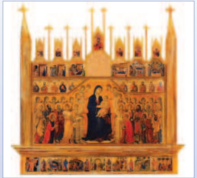
FÍOR 19.11 Mír altóra Maestà, Duccio di Buoninsegna

Chuirtear Míreanna Altóra ar altóirí na séipéal nó uaireanta chuirtear iad ina seasamh taobh thiar den altóir. Pictiúir a léirigh ábhair chráifeacha a bhí iontu agus is minic a bhí an cúl maisithe fosta. Thugtaí diptic ar mhír altóra a raibh dhá phainéal ann agus triptic ar mhír a raibh trí phainéal ann. Dá mbeadh níos mó ná trí phainéal sa mhír, thugtaí polaipitic uirthi. Bhíodh insí idir na painéil ar chuid de na míreanna sa dóigh go bhféadfaí iad a dhúnadh nuair nach raibh siad in úsáid, agus a oscailt arís ar ócáidí speisialta. Tar éis an Reifirméisín, cuireadh tabarnacail bhuna ar na haltóirí sna séipéil Chaitliceacha Rómhánacha leis an Naomhshairimint a choinneáil, agus ghlac siadsan ionad na míreanna altóra.