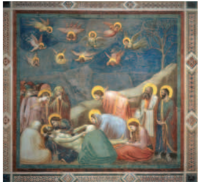
FIOR 19.6 AN CAOINEADH ÓS CIONN CHRÍOST, Giotto di Bondone, Cappella degli Scrovegni, Padova na hIodáile