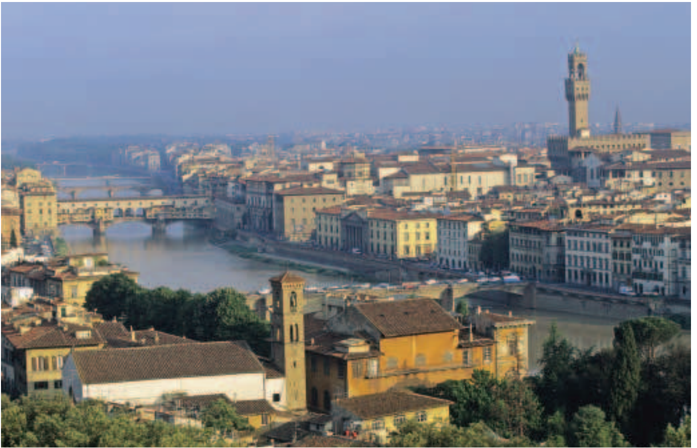
FÍOR 19.12 Flórans na hIodáile