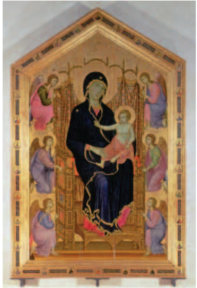
Fíor 19.3 MUIRE BANRÍON NA bhFLAITHEAS (MADONNA RUCELLI), Duccio, Dánlann Uffizi, Flórans

is go bhfuil sollúntacht le brath i ndreach na Maighdine, agus gurb ise an phearsa is mó san íomhá, ach léiríonn sé í mar bhean dhaonna agus í nádúrtha ina staidiúir.