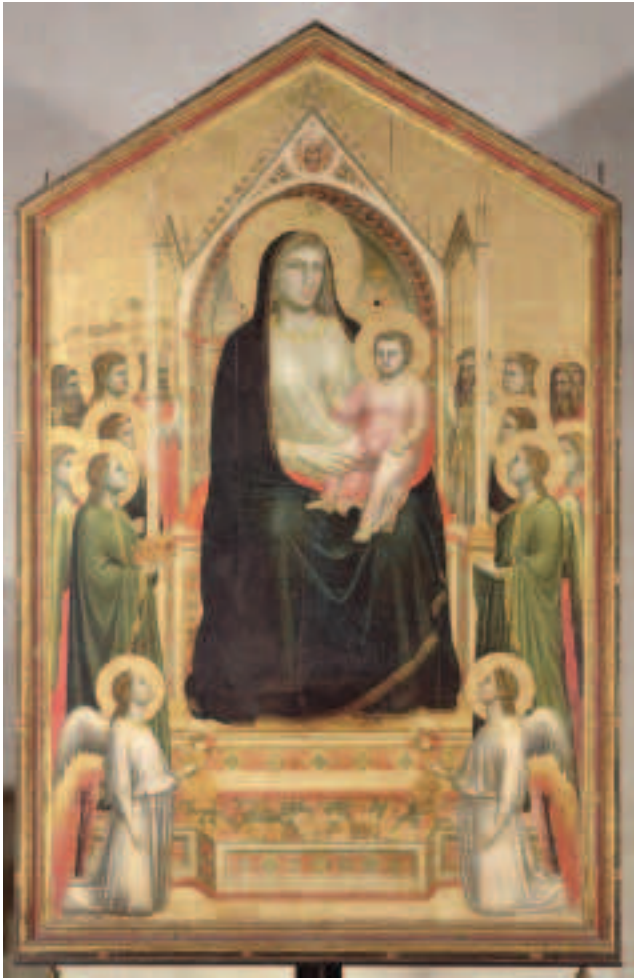
Fíor 19.2 OGNISANTI MADONNA (MUIRE BANRÍON NA bhFLAITHEAS), Giotto, Dánlann Uffizi, Flórans