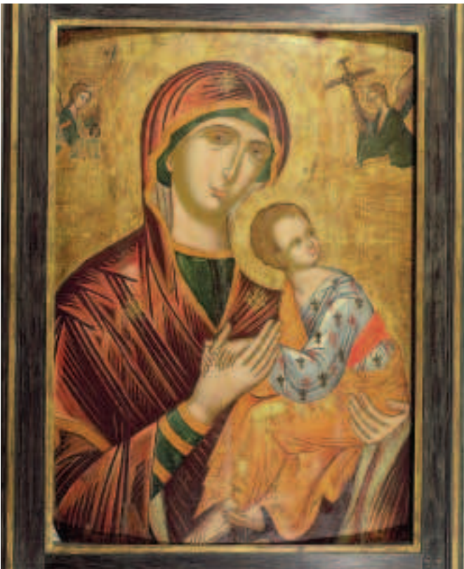
FÍOR 19.1 Máthair Dé na Páise – sampla d'Íocón Hodegetria, Bailiúchán Príobháideach

Ealaín Bhiosántach a thugtar ar an ealaín a bhain le hImpireacht na Biosáinte le linn na Meánaoiseanna, i.e. Impireacht Rómhánach an Oirthir. Ba í Constantín príomhchathair Impireacht na Biosáinte agus ba í an Ghréigis teanga an phobail. Stíl shaothraithe shollúnta atá ann, agus bíonn cuma neamhréalaíoch, theibí agus dhéthoiseach ar shaothair de chuid na stíle sin. Is é Íocón Hodaigeitria an pictiúr is mó le rá de chuid thraidisiún na Biosáinte agus is iomaí cóip den íocón sin a rinneadh i gcaitheamh na mblianta. Ciallaíonn an focal íocón 'íomhá'. Creideadh ag an am gurb é Naomh Lúcas Soiscéalaí a phéinteáil an bunpictiúr den Mhaighdean Mhuire, agus í os a chomhair (fíor 19.1).