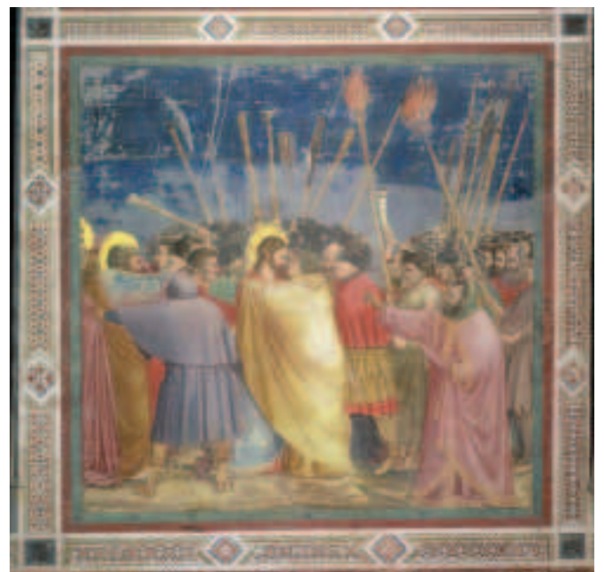
FIOR 19.7 PÓG IÚDÁIS, Giotto di Bondone, Cappella degli Scrovegni, Padova na hIodáile

Chlúdaigh Giotto ballaí an tséipéal bhig le freascónna a léirigh eachtraí as saol Íosa. Bhí an séipeal tiomnaithe do Mhuire na