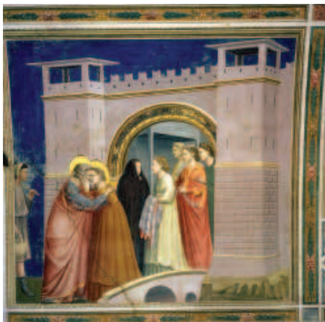
Fíor 19.8 IÓACHAIM AGUS ANNA AG AN NGEATA ÓRGA, Giotto di Bondone, Cappella degli Scrovegni, Padova na hIodáile

Sanaise, dá bhrí sin, is eachtraí as saol Mhuire, agus as saol a tuismitheoirí, Ióachaim agus Anna atá sna chéad radhairc sna freascónna. Leagadh béim ar thionchar truaillitheach an airgid sna híomhánna – Íosa ag ruaigeadh lucht malartaithe an airgid as an teampall, nó lúdas, a chroch é féin mar gur ghlac sé airgead ó naimhde Íosa.