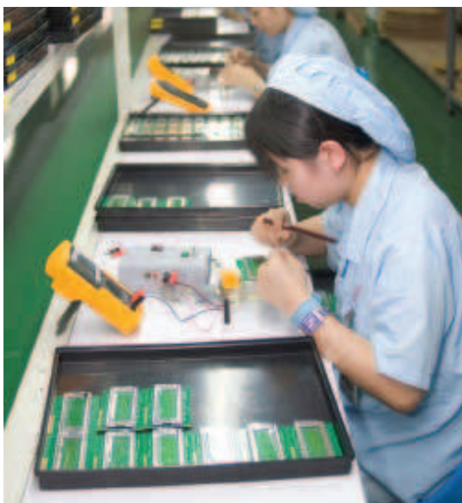
FÍOR 3.31 Tástáil ar líne tháirgthe

Ba chóir go ndéanfaí forbairt agus tástáil ar an táirge chun an próiseas déantúsaíochta a fheabhsú agus chun a chinntiú go mbeidh an táirge deiridh sábháilte agus go mbeidh dea-chuma air. Is féidir an ríomhtheicneolaíocht a úsáid chun cuid mhaith den tástáil a dhéanamh go fíorúil. Sábhálann sé sin am agus airgead mar ní bhíonn athruithe le déanamh ar an innealra i rith an phróisis táirgeachta (fíor 3.31).