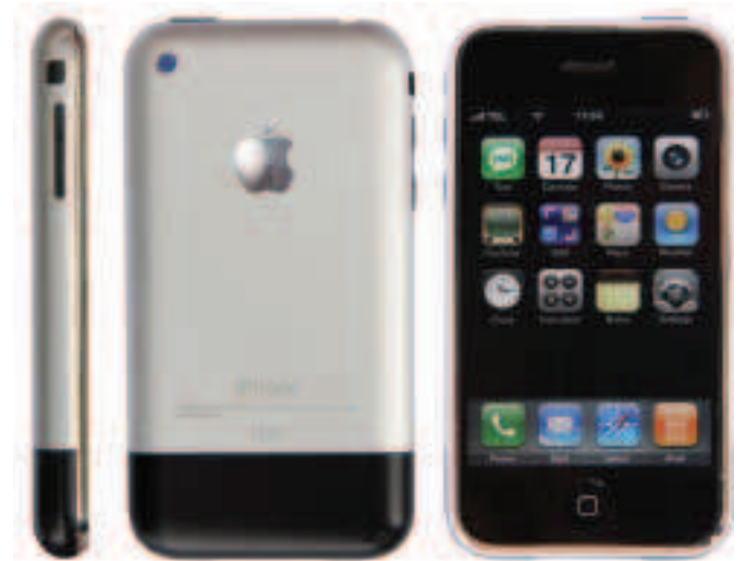
FÍOR 3.26 Apple iPhone

thart agus níos tábhachtaí fós, bhí sé furasta a úsáid. Ba léir go raibh a mhachnamh déanta ag an dearthóir ar an gcuma a bheadh air, chomh maith leis an teicneolaíocht a bheadh taobh istigh de. Ina dhiaidh sin, dhear Ive an iPod agus an iPhone (fíor 3.26). Tá siad sin furasta a úsáid agus tá an teicneolaíocht is nua atá ann iontu.