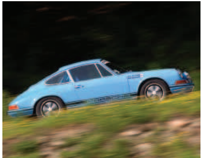
Fíor 3.14 Porsche 911