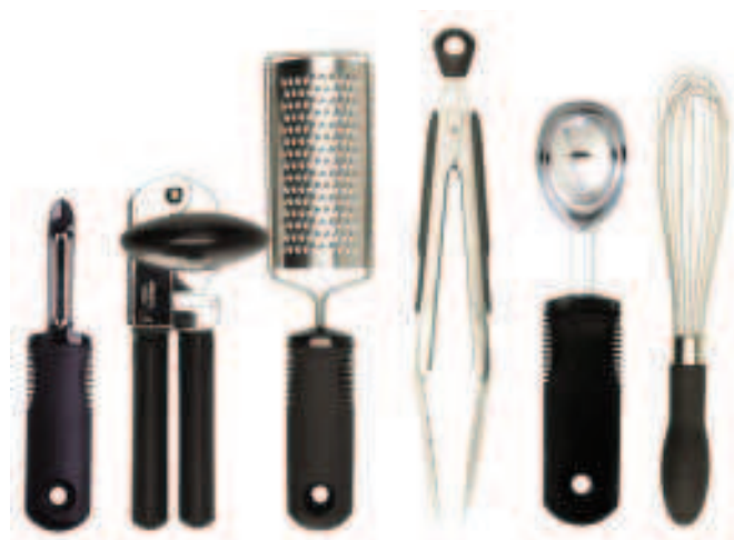
FÍOR 3.32 Uirlisí cistine Oxo Good Grips

Na bunphrionsabail a bhí ag William Morris sna 1850idí maidir leis an rud is dea-dhearthóireacht ann, tá siad fós bailí. Den chuid is mó, tá fíoraithe ag dearthóirí ó shin i leith go bhfuil fónamh sna prionsabail seo a leanas: 'an dearadh a bheith dílis don bhunábhar', 'an dearadh a bheith oiriúnach don fheidhm' agus 'an cruth a bheith de réir feidhme'. Déantar leathnú agus simpliú ar na prionsabail sin thíos, chomh maith le cur síos ar chásanna samplacha ina léirítear conas is féidir na prionsabail a chur i bhfeidhm agus táirgí á meas.