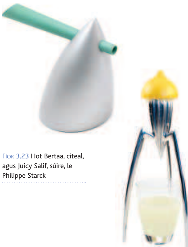
Fíor 3.23 Hot Bertaa, citeal, agus Juicy Salif, súire, le Philippe Starck

dhosmálta agus tá a ainm féin le feiceáil uirthi. Rinne Alessi ailtirí agus dearthóirí cáiliúla as gach cearn den domhan a choimisiúnu chun foirne tae, foirne caife agus citil a dhearadh. Bhí siad le cur ar taispeáint ansin i ngailearaithe agus i músaeim amháil is gur saothair ealaíne a bhí iontu seachas earraí feidhmiúla tí. Bhí greann cliste sa dearadh acu go minic. Uaireanta bhain an greann le feidhm an earra féin, uaireanta eile bhí tagairt stairiúil ann. Dhear an dearthóir Francach Philippe Starck citeal darbh ainm Hot Bertaa agus súire líomóide ar thug sé Juicy Salif air (fíor 3.23). 'Ní chun liomóidí a bhrú an súire seo, ach chun comhrá a spreagadh,' a dúirt sé.