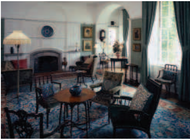
Fíor 3.5 Parlús i dteach Standen, Sussex, Sasana a bhfuil páipéar balla agus cumhdach troscáin ann le William Morris agus gréas lus na gréine orthu.

Chreid Ruskin agus Morris nach raibh na dearáí a chonaic siad ealaíonta ná dea-chumtha agus theastaigh uathu é sin a athrú. Is as sin a tháinig gluaiseacht na dearthóireachta nua-aoisí sa 20ú haois (fíor 3.5).