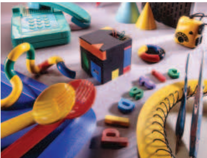
FÍOR 3.18 Thug an plaisteach roghanna breise do dhearthóirí maidir le dathanna agus le chruthanna.

Ó na 1960idí ar aghaidh, bhí mórán cineálacha éagsúla plaisteach á dtáirgeadh agus dathanna geala pléascacha orthu. Is féidir an iliomad cruthanna a mhúnlú as plaisteach. D'fhág sé sin go raibh deiseanna ag an dearthóir nach raibh aige riamh roimhe sin agus é ag roghnú dathanna agus línte deartha. De bharr go mbíonn praghas an-íseal ar rudaí a olltáirgtear as plaisteach, ní fiú iad a dhéanamh ach má chaitear ar shiúl iad i ndiaidh iad a úsáid aon uair amháin, nó geall leis. I ndeireadh an 20ú haois, bhí éileamh ar shoithigh stórála bia agus ar earraí saora cistine agus picnice a bhí déanta as plaisteach.