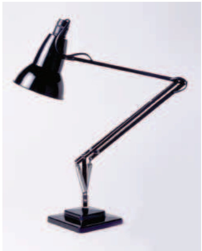
Fíor 3.35 Lampa infhillte Anglepoise le Comhlacht Terry Spring atá á tháirgiú ó 1932 i leith

Níl sa mhéid thuas ach achoimre ar na príomhphointí a bhainfeadh le táirgí a dheardh. Dá mbeadh duine chun anailís iomlán a dhéanamh ar dheardh ar bith, níor mhór plean a leagan amach agus na ceithre phointe thuas mar bhun leis. Dá mbainfeadh sé le hábhar, ba chóir go mbeadh tagairtí san anailís do dhearthóirí aonair agus do chomhlachtaí móra dearthóireachta.