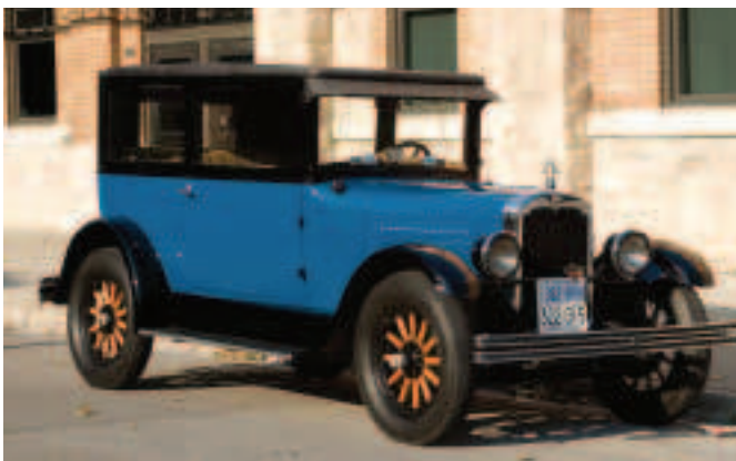
Fíor 3.7 Gluaisteán de chuid General Motors (Oldsmobile Model E, 1927)

Creidtear gurb é Henry Ford a d'eagraigh an chéad líne chóimeála ghluasteach in 1914 ionas go bhféadfaí a chuid gluasteán a thógáil (fíor 3.6). Rinne Ford an carr Model T, carr a bhí measartha neamhchostasach agus furasta a dheisiú agus a choinneáil. Ach níorbh fhada go raibh General Motors ag díol níos mó carranna ná Ford mar go raibh raon de chineálacha acu. Bhí an bunfhráma céanna faoi na cineálacha éagsúla – Cadillac, Pontiac, Buick, Chevrolet agus eile – ach bhí raon faoi leith dathanna agus stíleanna ag dul le gach cineál. Theastaigh ó General Motors go mbeadh gach cineál éagsúil in oiriúint do sciar faoi leith den phobal a bheadh ag ceannach carranna. Thuig Ford go luath gur fearr le daoine rogha a bheith acu, fiú nuair a bhí luach maith le fáil ar an táirge féin (fíor 3.7).