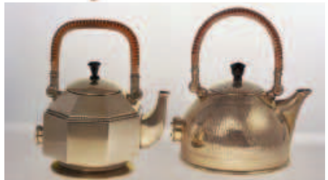
Fíor 3.9 Citil leictreacha a dhear Peter Behrens do AEG, Beirlín