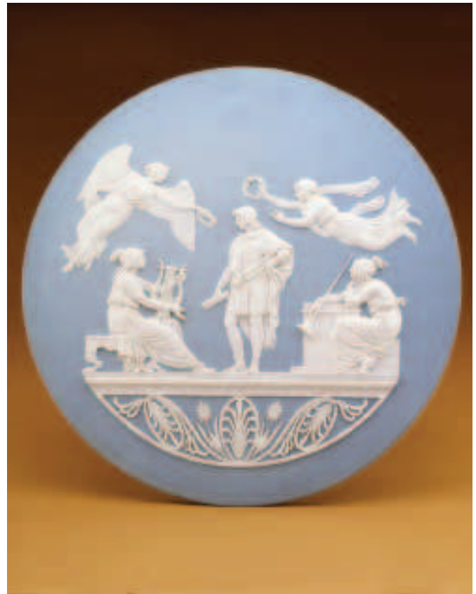
FÍOR 3.2 Pláta Wedgwood a dhear John Flaxman