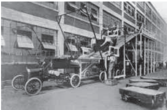
Fíor 3.6 Oibrithe gluasteáin ar fánán ar líne chóimeála taobh amuigh ag Ford Motor Company, Highland Park, Michigan agus iad ag cur chabhail an chairr Ford Model T síos i bhfráma.

Chreid Ruskin agus Morris nach raibh na dearáí a chonaic siad ealaíonta ná dea-chumtha agus theastaigh uathu é sin a athrú. Is as sin a tháinig gluaiseacht na dearthóireachta nua-aoisí sa 20ú haois (fíor 3.5).