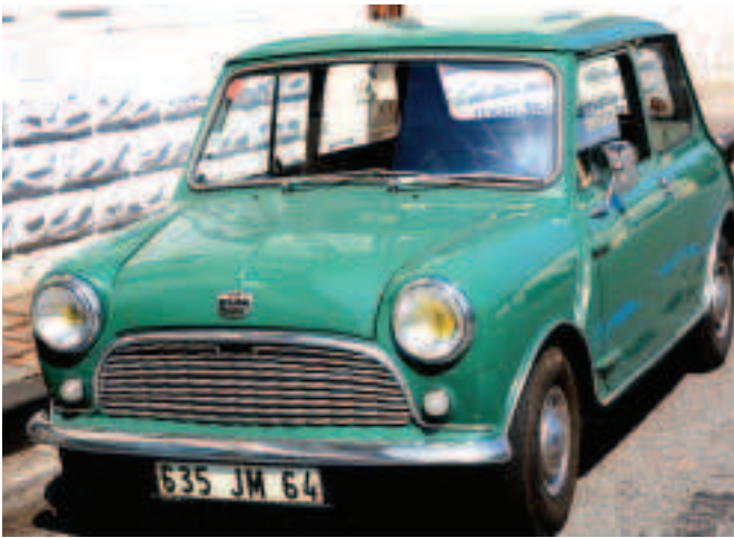
FÍOR 3.16 Austin Mini den bhundearadh

Tá faisean tagtha chun cinn carranna barainne ó na 1950idí agus na 1960idí a athdhearadh, mar bíonn an-tóir ar rudaí a bhfuil cuma an déanaimh sin orthu. Rinne Fiat athdhearadh ar an 500, cineál cairr a bhí á tháirgeadh acu roimh thús an Dara Cogadh Domhanda go 1975. Eiseamláir de dhearadh agus de stíl na 1960idí ba ea é an Austin/Morris Mini agus bhíodh tóir air i gcónaí. Dá bharr sin, rinneadh athdhearadh air chun go mbeadh tóir air arís san 21ú haois (fíor 3.16, fíor 3.17).