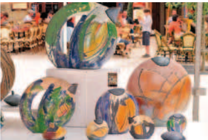
FÍOR 3.1 Ceirdphotaireacht nua-aimseartha

Is nuair a tháinig méadú ar tháirgeacht a thosaigh dearthóirí nach déantóirí iad ag dul i mbun obair deartha den chéad uair. Sa cheathrú haois déag, d'íoctaí níos mó le lucht deartha taipéisí ná mar a d'íoctaí leis na hoibrithe a dhéanadh iad. I rith na Réabhlóide Tionsclaíche, d'fhaigheadh lucht deartha in earnáil na tionsclaíochta pá níos fearr ná na hoibrithe sna monarchana. Bhí an t-ealaíontoir John Flaxman ar dhuine de na healaíontóirí ba luaithe a raibh baint aige leis an bpróiseas tionsclaíoch. Bhíodh earraí ceirmeacha á dtáirgeadh ar bhonn tionsclaíoch ag Josiah Wedgwood ach dhéanadh an t-ealaíontóir John Flaxman píosaí maisiúla a dhearadh dó le haghaidh na ndaoine ba shaibhre agus ba ghéarchúisí dá chuid custaiméirí (fíor 3.2). In 1754 d'fhoilsigh an caibinéadaire Thomas Chippendale leabhar de na dearáí a bhí ceaptha