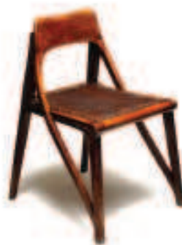
Fíor 3.8 LITTLE WALNUT CHAIR (Cathaoir Bheag d'Adhmad Gallchnó) le Richard Riemerschmid, an Ghearmáin, 1899

Bunaíodh Der Deutscher Werkbund sa Ghearmáin in 1907. Tugadh déantúsóirí, díoltóirí, polaiteoirí, ailtirí agus dearthóirí le chéile chun táirgí a chruthú a rachadh in iomaíocht le táirgí a bhí á ndéanamh sa Bhreatain agus i Meiriceá. Na prionsabail dearthóireachta a bhí acu, bhí siad cosúil leis na prionsabail a bhí ag Gluaiseacht na nEalaíon agus na Ceardaíochta. Chreid siad gur cheart go mbeadh an cruth de réir na feidhme agus gur chóir fáil réidh le gnéithe maisithe. Bhí Richard Riemerschmid ar dhuine de na dearthóirí leis an ngrúpa agus tháirg sé troscán beag a dhéantaí ar mheaisín (fíor 3.8). Duine eile acu ba ea Peter Behrens, fear a thosaigh ag obair i bpáirt leis an gcomhlacht déantúsaíochta AEG ( Allgemeine Elektrizitäts-Gesellschaft ) chun táirgí a dhearadh agus a tháirgeadh, chun monarachana a thógáil agus chun fógraí a dhéanamh. Bhí féiniúlacht ag baint le gach dá ndearna siad agus b'eiseamláir luath é den fhéiniúlacht chorparáideach a shamhlaímid le comhlachtaí móra sa 20ú haois (fíor 3.9).