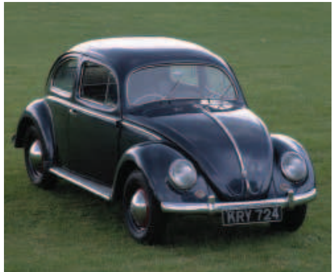
Fíor 3.13 Volkswagen Beetle 'An Chiaróg' 1953

simplí agus iontaofa i gcomparáid le carranna eile na linne. Bhí an t-inneall neamhchoitianta ag an am: inneall cothrománach ceithre shorcóir ab ea é agus bhí sé suite i gcúl an chairr. Bhí sé aerfhuaraithe agus bhí an tiomáint sna rothaí deiridh. Bhí córas crochta neamhchoitianta faoi chomh maith (fíor 3.13). Tar éis an Dara Cogadh Domhanda, tháinig méadú ar an éileamh a bhí ar an gCiaróg. Rinneadh Ciaróga a impórtáil go hÉirinn ó na 1950idí ar aghaidh. Thagaidís isteach i gcliathbhoscaí móra agus iad leathdhéanta. Cuireadh le chéile iad i monarcha ar Bhóthar Shíol Bhroin i mBaile Átha Cliath, áit a bhfuil díoltóir VW fós sa lá atá inniu ann. D'úsáid Porsche gnéithe a bhí bunaithe ar pháirteanna an Volkswagen agus é ag déanamh a chéad charr spóirt. Tá inneall uiscefhuaraithe sa Porsche 911 agus tá an t-inneall cóngarach do na rothaí deiridh i lár an chairr. Tá an Porsche 911 iomaíoch fós sa 21ú haois (fíor 3.14). Le linn na 1990idí bhí tóir ar an dearadh siarghabhálach nó 'reitreo'. Is as sin a d'eascair an Chiaróg nua. Ní raibh de chosúlacht idir í agus an seanChiaróg ach an chuma a bhí ar an taobh amuigh. Bhí inneall uiscefhuaraithe inti a bhí suite chun tosaigh sa charr agus bhí an tiomáint sna rothaí tosaigh (fíor 3.15).