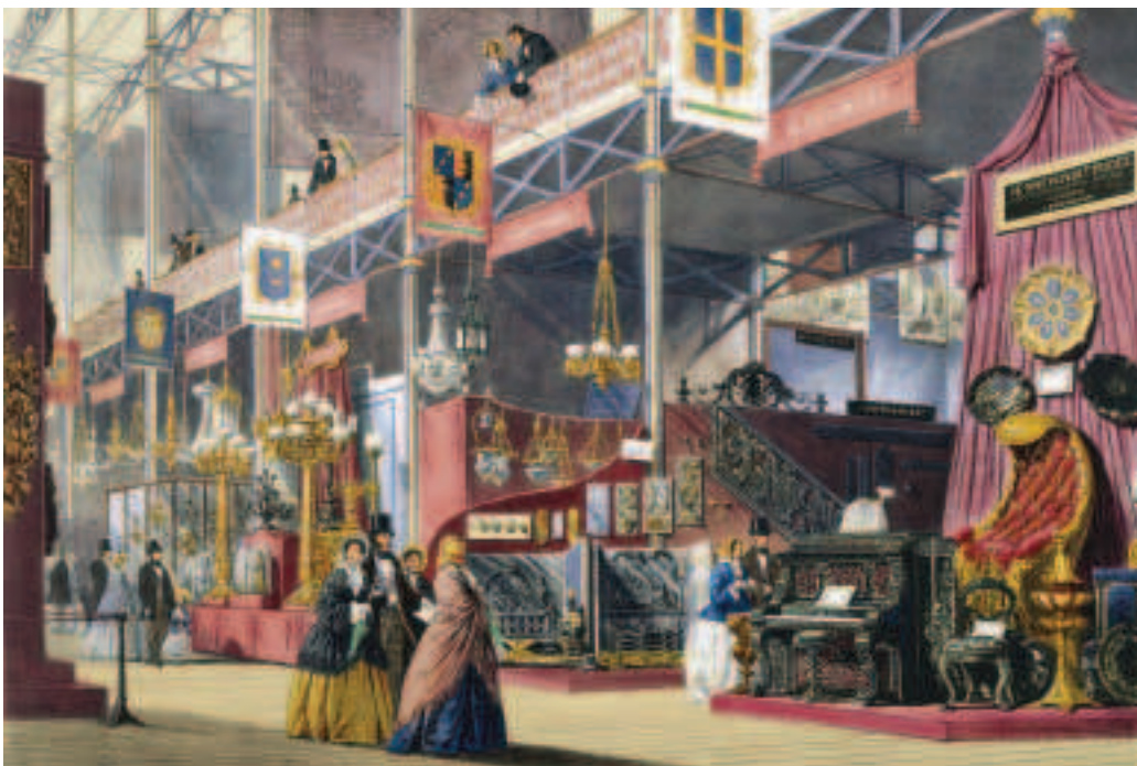
FÍOR 3.4 Leathanach pictiúir as Comprehensive Pictures of the Great Exhibition (1854). Tabhair faoi deara an méid earraí an-mhaisithe atá ar taispeántas.