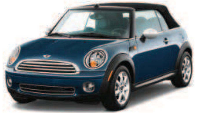
FÍOR 3.17 Mini Cooper 2010

De bharr na teicneolaíochta nua, tá roghanna nua ag dearthóirí sa 21ú haois maidir le hábhar agus le comhdhéanamh, roghanna nach bhfacthas a leithéid go dtí seo (fíor 3.18).