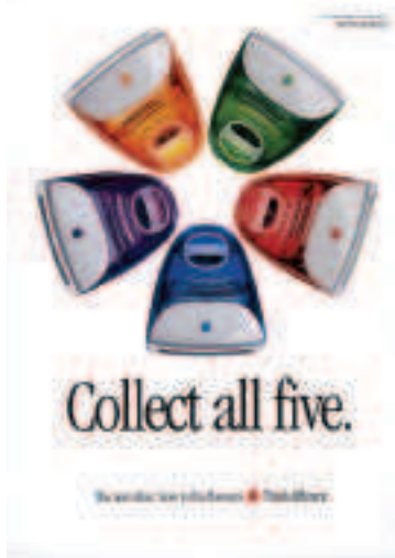
FÍOR 3.25 Fógra le haghaidh Apple iMac, 1999

D'éirigh go hiontach leis an gcorparáid Apple an teicneolaíocht a phósadh ar stíl mhaireachtála an duine. Is é an sprioc a bhíonn acu, ríomhairí agus trealamh leictreonach eile a dhearadh ionas go mbeidh siad furasta le húsáid. Chomh maith leis sin, bíonn aird faoi leith acu ar an dearadh ón tús agus earra nua á cheapadh acu. Is ar na cúiseanna sin atá ag éirí chomh maith leo. Dhear Jonathan Ive iMac do Apple in 1999 (fíor 3.25). Bhí an iMac déanta as plaisteach, bhí cás geal trédhearcach daite air, bhí sé ciúin agus furasta a iompar