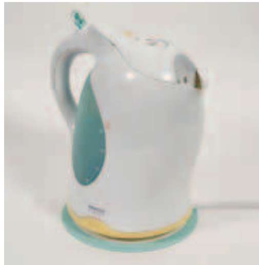
Fíor 3.34 Citeal leictreach nua-aoiseach

agus rialtáin an chairr furasta a fheiceáil agus a aimsiú. Caithefear an spriocmhargadh a chur san áireamh chomh maith. Ní hionann na sonraí a bhainfidh le carr salúin teaghlaigh agus le carr spóirt.