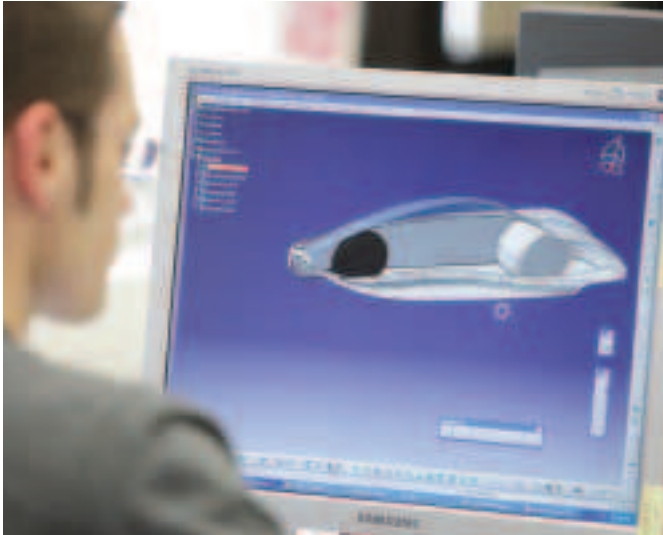
Fíor 3.28 Dearthóir táirgí ag obair le clár DRC

Dar le roinnt daoine nach bhfuil aon ghá le dearthóir a thuilleadh agus na bogearraí ríomhaireachta atá ar an bhfód anois. Is féidir obair an dearthóra grafaice a dhéanamh ach cláir grafaice a bheith ar an ríomhaire agat. Chomh maith leis sin, is iontach an áis d'ailtirí agus do dhearthóirí táirgí iad na cláir dearadh ríomhchuidithe (DRC). Cuireann na cláir sin ar a gcumas íomhánna tríthoiseacha a chruthú dá gcuid dearáí, nó fréamhshamlacha a chruthú go fiú (fíor 3.28).