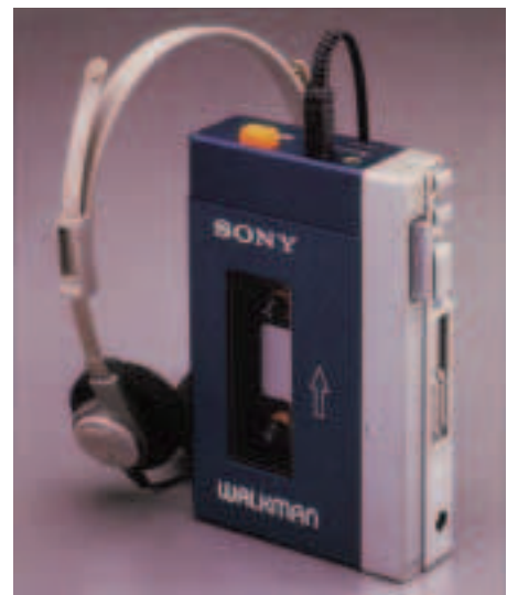
FÍOR 3.19 Sony Walkman den chineál a rinneadh sna 1970idí

In 1985 a rinneadh an ciorcad iomlánaithe den chéad uair. Bhí an iliomad féidearthachtaí ag baint leis ach ba iad na Seapánaigh a bhí ar thús cadhnaíochta chun úsáid a bhaint as. Rinne siad réimse de gairis leictreonacha a tháirgeadh ar phraghas íseal agus bhí éileamh láithreach orthu ar fud an domhain. Thosaigh Sony ag déanamh teilifíseán agus raidiúnna beaga. Chruthaigh siad bealach nua chun éisteacht le ceol nuair a rinne siad an Sony Walkman sna 1970idí.