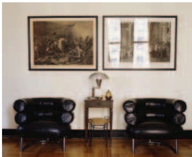
Fíor 3.11 Bibendum Chair agus E-1027 (ar bharr) le Eileen Gray. Rinneadh E-1027 ionas go mbeadh an bord thar leaba nó cathaoir.

Bhunaigh Henry Dreyfus (1904-1972) comhlacht dearthóireachta atá fós i mbun gnó i gCathair Nua Eabhrac. Bhí sé ar dhuine de na príomhdhearthóirí i Meiriceá le linn na 1930idí agus na 1940idí. Na tionscadail ar oibrigh sé orthu, cuimsíonn siad réimse thar a bheith leathan. Ina measc sin bhí teileafóin agus galairainn, chomh maith le cóiríúchán níos éifeachtúla ar thraenacha. Sna 1960idí, d'fhoilsigh sé an leabhar The Measure of Man . Leabhar tagartha faoin eirgeanamaíocht a bhí ann agus bhí tionchar mór aige ar an dearthóireacht (fíor 3.12). Eolaíocht is ea an eirgeanamaíocht ina gcuirtear teoiricí eolaíochta i bhfeidhm chun go mbeidh an obair, an trealamh agus an t-ionad oibre ar fad in oiriúint don oibrí. Tá dhá sprioc leis an eirgeanamaíocht: an tsláinte agus an táirgiúlacht. San ionad oibre a bhfuil dearadh eirgeanamaíoch faoi, ba cheart go mbeadh níos lú struis ar na hoibríthe agus iad ag obair ann, ag imeacht tríd nó ag baint úsáide as troscán agus as innealra atá ann.