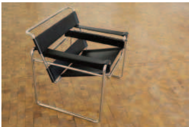
Fíor 3.10 Sárdhearadh de chuid an Bauhaus, WASSILY SESSEL le Marcel Breuer, 1925

Osclaíodh scoil dearthóireachta Bauhaus in 1919 in Weimar sa Ghearmáin. Is í an aidhm a bhí léi ná an dearthóireacht agus na healaíona a thabhairt le chéile agus prionsabail aontaithe a chur i bhfeidhm, prionsabail a bhí cosúil leis na prionsabail a bhí ag Gluaiseacht na nEalaíon agus na Ceardaíochta. In 1925 aistríodh an scoil go foirgnimh nuálacha nua-aoiseacha a dhear Walter Gropius agus mic léinn de chuid an choláiste in Dessau. An dearthóireacht thionsclaíoch a bhí chun cinn sa scoil. Dhéantaí dearáí agus múnlaí samplacha i gceardlanna na scoile a bhféadfaí a olltáirgeadh. Rinneadh troscán agus feistis le haghaidh na bhfoirgneamh nua sna ceardlanna chomh maith. Ba mhór an scéal é an troscán nua-aoiseach a dhear Marcel Breuer ag an am. As feadáin cruach a rinneadh é agus bhí an-tóir air (fíor 3.10).