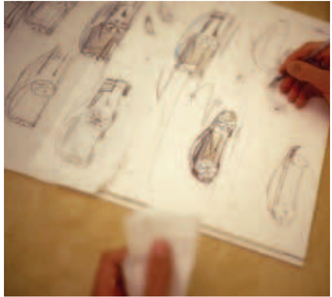
Fíor 3.29 Léaráidí de dhearadh táirge

Is é atá i gceist leis an bpróiseas deartha ná na céimeanna a leanann dearthóirí agus a fhágann go mbíonn rialtacht