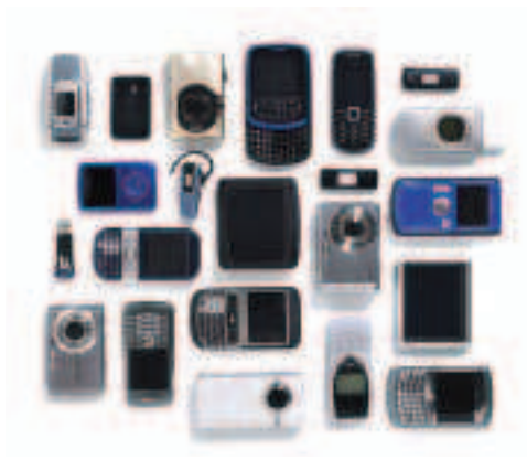
Fíor 3.20 Giuirléidí leictreonacha na linne seo