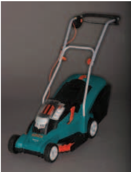
Fíor 3.33 Lomaire faiche leictreach Bosch