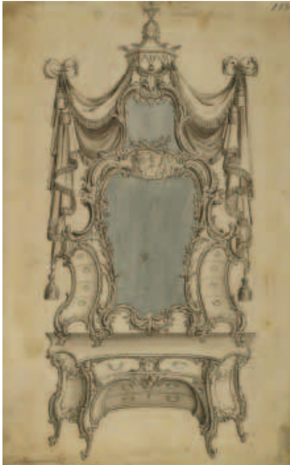
FÍOR 3.3 Dearadh le Chippendale de bhord maisiúcháin do fhear

á ndéanamh ag an am in earnáil na déantúsaíochta a chur ar taispeántas (fíor 3.4). Formhór na n-earraí a bhí ar taispeántas bhí siad an-mhaisithe ar fad agus úsáideadh neart ábhair luachmhara chun iad a dhéanamh.