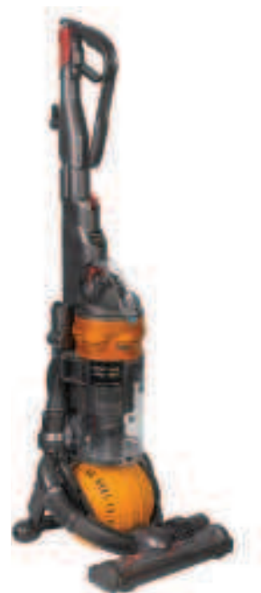
FÍOR 3.27 Dyson Ball DC25

Dearadh eile a sheasann amach ná an folúsghlantóir cioclóin a dhear James Dyson . Cé go bhfuil dreamanna eile tar éis an teicneolaíocht chéanna a úsáid ó shin, seasann an bundearadh a rinne Dyson amach fós leis na dathanna láidre a d'úsáid sé. Dála Apple, bíonn sé i gconaí cur leis an dearadh sin agus á fhorbairt. Chuir sé casadh nua sa Dyson Ball DC25 arís ina dhiaidh sin: fuarthas réidh leis na rothaí fosaithe agus cuireadh liathróid mhór amháin faoi ina n-áit (fíor 3.27).