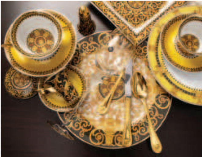
FÍOR 3.24 Foireann dinnéir de chuid Versace