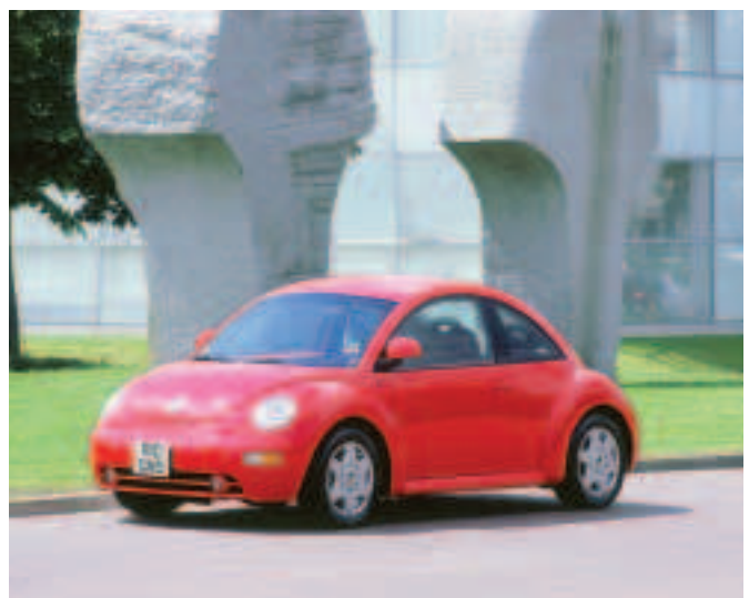
Fíor 3.15 Volkswagen Beetle 'An Chiaróg' 1998