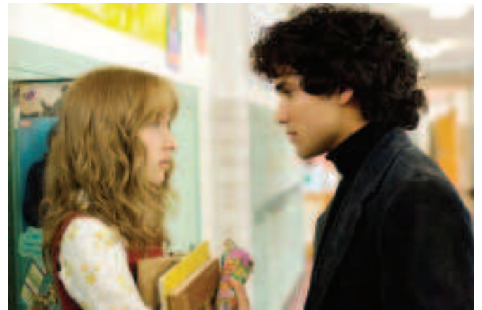
FIOR 4.15 Níl ach na haisteoirí i bhfócas géar sa radharc seo as THE LOVELY BONES, 2009.

I laethanta luatha na pictiúrlainne a tuigeadh go bhféadfaí éifeacht a bhaint as tarraingt an fhócais (is é sin go n-aistrítear an fócas ó rud amháin go dtí rud eile sa radharc). Sa scannán Let Me Dream Again (1900), le A.G. Smith, feictear fear ag pógadh bean álainn. Téann an pictiúr as fócas de réir a chéile agus nuair a thagann an íomhá ar ais i bhfócas tá sé ag pógadh a mhná céile, nach bhfuil chomh tarraingteach. Roimh i bhfad, ba é sin an gnáthbhealach le sraitheog bhrionglóide a chur i láthair. Nuair a úsáidtear lionsa fada a bhfuil cró mór air fágann sé nach mbíonn ach crios caol den radharc i bhfócas ag am ar bith, rud ar a dtugtar doimhneacht réimse. Úsáidtear é sin i seatanna teanna mar bíonn aghaidh an aisteora i bhfócas géar agus an cúlra doiléir. I léiriúcháin mhóra, bíonn fócasóir ann chun a chinntiú go bhfuil an fócas beacht i ngach seat. Gné thábhachtach den fhócas is ea zúmáil. Mar shampla, d'fhéadfadh an ceamaradóir an fad fócais a athrú chun aistriú ó sheat teann go seat leathanuilleach (fíor 4.15).