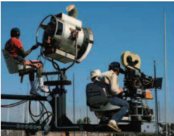
Fíor 4.17 Teicneoirí soilsiú i mbun oibre

Bunghné den scannánaíocht a bhí sa soilsiú riamh. Nuair a thóg Edison a chéad stiúideo scannán, an Black Maria, in 1893, bhain sé leas as soilsiú saorga chun scannánú sa seomra dorcha. Rinneadh na scannáin luatha a scannánú faoi sholas nádúrtha san Eoraip, ach de réir mar a tháinig feabhas ar na teicnící scannánaíochta níorbh fhada go raibh an soilsiú ina dhlúthchuid de phróiseas na scannánaíochta. Baintear leas as an soilsiú chun atmaisféar a chruthú agus chun mothúcháin faoi leith a spreagadh sa lucht feáchana. Cuid ríthábhachtach de radharc ar bith is ea caighdeán, dath, déine agus treo an tsolais (fíor 4.17).