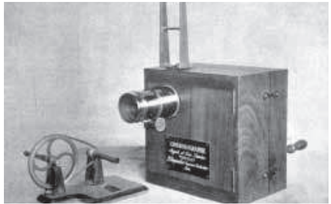
Fíor 4.1 Ba theilgeoir é ceamara Lumière agus d'úsáidtaí é chun an scannán a réaladh chomh maith.

Tháinig forbairt mhór ar na ceamaraí ina dhiaidh sin. Mar shampla, cuireadh barr feabhais ar na comhlaí iontu. Ansin, tháinig an lúb Latham ar an saol, gaireas a rinneadh chun go rachadh an scannán isteach sa cheamara nó sa teilgeoir go réidh gan bhriseadh. D'éirigh ceamaraí níos iontaofa dá bharr, agus bhí siad níos éifeachtaí chun scannáin níos faide a dhéanamh.