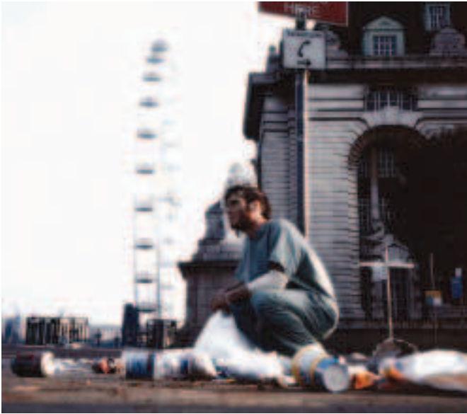
FIOR 4.14 Seat íseal as 28 DAYS LATER, 2002

comhréidh nó seat ar leibhéal na súl go minic nuair a bhíonn idirghníomhaíocht nó caidreamh idir charachtair á léiriú ar an scáileán. Is minic a dhéantar comhráití nó achrainn a scannánú ar an mbealach sin sa chaoi go mothóidh an breathnóir go bhfuil sé páirteach sa rud atá ag tarlú. Déantar seat anuas a scannánú ó áit díreach os cionn an radhairc. Claontar an ceamara i leataobh freisin sa chaoi go mbíonn an léaslíne ar fiar ar an scáileán. Claonseat a thugtar ar a leithéid sin.