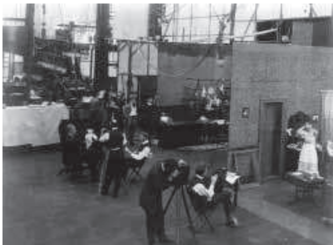
FÍOR 4.9 Ag scannánú le ceamara seasta, c. 1924