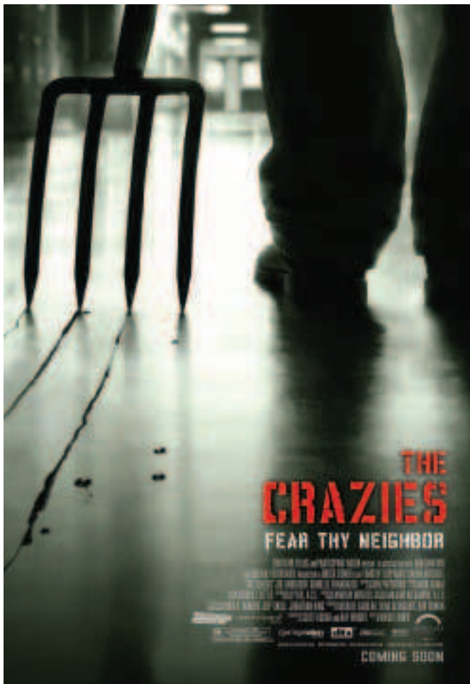
FIGÚR 4.18 Póstaer i gcomhair an scannáin THE CRAZIES, 2010

Is ar an bhfoireann léiriúcháin a bhíonn an fhreagracht deiridh maidir le bailchríoch a chur ar scannán. Is gcás scannán mór, bíonn léiritheoirí feidhmiúcháin, léiritheoirí agus cúntóirí léiriúcháin páirteach ann. Bíonn raon iomlán de phearsanra airgeadais agus teicniúil atá freagrach do na léiritheoirí agus bíonn siad go léir ag iarraidh siamsaíocht pictiúrlainne a dhéanamh de scéal an scannáin, agus brabach a dhéanamh air. Is faoin léiritheoir é an scríbhneoir scáileáin, an stiúrthóir, an fhoireann aisteoirí, na hairgeadaithe agus an fhoireann léiriúcháin a thabhairt le chéile i dtimpeallacht chruthaitheach. I ndeireadh na dála, an fhreagracht is mó atá ar na léiritheoirí ná a chinntiú go n-éiríonn go maith leis an scannán. Go minic, bíonn an bunsmaoineamh ag an léiritheoir le linn chéim forbartha an scannáin. D'fhéadfadh sé gurbh eisean a bhí ag iarraidh an scannán a dhéanamh ar an gcéad dul síos, nó gur leis cearta an scéil. Más gá, fostaíonn an léiritheoir scríbhneoir scáileáin agus foireann d'eagarthóirí scéil. Bíonn ar an bhfoireann léiriúcháin airgead a chruinniú chomh maith. Le linn an phróisis réamhléiriúcháin , tugann an léiritheoir na príomhdhaoine le chéile, an stiúrthóir, an scannánaí agus na príomhaisteoirí ina measc. Uaireanta bíonn na daoine sin go léir páirteach san iarracht le tacaíocht airgeadais a fháil i gcomhair an scannáin. In eagrais mhóra, leithéidí Paramount nó MGM, bíonn foireann faoi leith ann a bhfuil cúram an airgeadais orthu