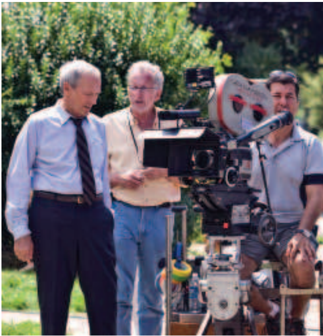
Fíor 4.19 An stiúrthóir Clint Eastwood i mbun oibre ar sheit GRAN TORINO, 2008

ag stiúradh na n-aisteoirí le linn cleachtaí agus scannánaíochta. Na ceamaraí agus an tslí a socraítear iad, cúrsaí fuaimne, an soilsiú, an dearadh agus na héifeachtaí speisialta, rudaí iad sin ar fad a chuireann go mór le rath scannáin. Bíonn ar an stiúrthóir na nithe sin ar fad a tharraingt le chéile chun scannán maith a dhéanamh (fíor 4.19).