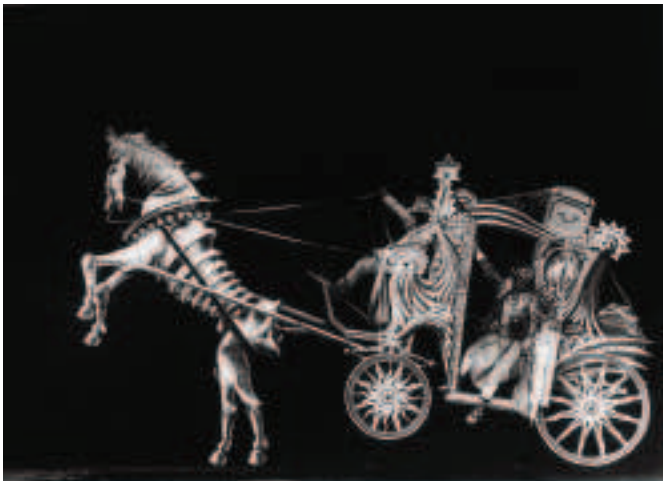
Fíor 4.12 Bhí idir chleasa ceamara agus radharcra a rinneadh as pictiúir sa scannán CINDERELLA le George Méliès.