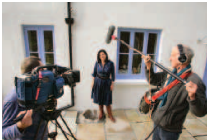
FÍOR 4.8 Clár teilifíse á scannánú le físcemara

QuickTime nó MPEG-4. Braitheann caighdeán an fhíseáin ar an modh a úsáidtear chun é a ghabháil agus a stóráil. Má úsáidtear físcemara tráchtála ardchaighdeán, is féidir íomhánna a fháil atá inchurtha le rud a bheadh le feiceáil sa phictiúrlann. Ach má úsáidtear gléas de chaighdeán níos ísle (fón póca, mar shampla) ní bhíonn caighdeán na n-íomhánna chomh maith céanna (fíor 4.8).