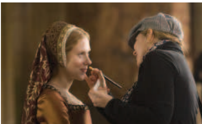
FÍOR 4.22 Smideadh á chur ar aisteoir le haghaidh an scannáin THE OTHER BOLEYN GIRL, 2008

Pléann an cinematagrafaí agus an stiúrthóir gach radharc chun an ghrúpáil a shocrú (an áit a mbeidh na haisteoirí