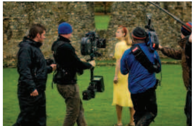
FÍOR 4.23 Scannánóir i mbun oibre le Steadicam, GLORIOUS 39, 2009

Uaireanta bíonn an ceamara féin in ann níos mó a chur in iúl faoina bhfuil ar siúl i radharc ná mar a bhíonn comhrá nó ceol. Bíonn an stiúrthóir fótagrafaíochta (nó cinematagrafaí ) ag féachaint le cuma leithleach a chur ar an scannán. Téann sé