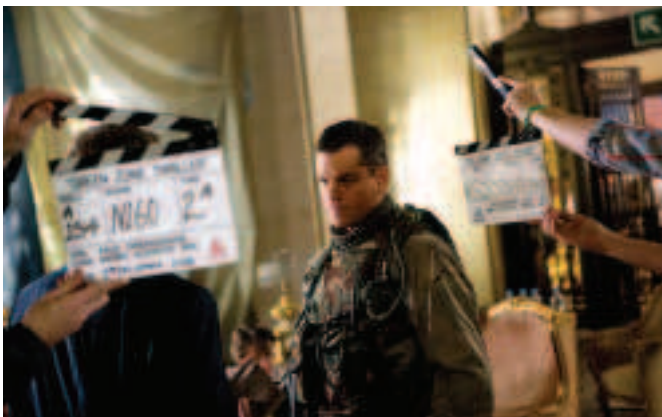
FÍOR 4.3 Clabairí á n-úsáid ar sheit GREEN ZONE, 2009

Tháirg Edison Manufacturing Company an cinéascóp, gaireas chun amharc ar scannán. Dá bharr sin, ba ghá go mbeadh méid caighdeánach scannáin ann. Shocraigh siad ar scannán 35 mm mar chaighdeán, agus is é sin an méid caighdeánach scannáin in earnáil na scannánaíochta ó shin. Bhí Biograph ar an gcéad chomhlacht sna SA a dhírigh go hiomlán ar scannáin a tháirgeadh agus a thaispeáint. D'úsáid siad scannán 68 mm ón mbliain 1895 go dtí na 1900idí luatha ina gcuid scannán, ach cé go raibh cáil ar chaighdeán a scannán, ní raibh Biograph ábalta dul in iomaíocht leis na scannáin 35 mm a bhí á n-olltáirgeadh. Thar na blianta, rinneadh scannáin i bhformáidí