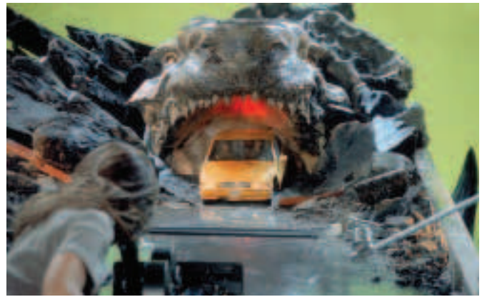
Fíor 4.6 Mionsamhail á húsáid le haghaidh éifeacht speisialta in GODZILLA, 1998

Ní raibh i gcuid de na teilgeoirí luatha ach ceamairí a raibh lampa agus frithchaiteoir iontu chun an íomhá a theilgean. De réir mar a d'éirigh pictiúrlanna níos mó, theastaigh solas níos láidre sna teilgeoirí chun go mbeadh na híomhánna le feiceáil níos faide ar shiúl agus b'éigean teilgeoirí ar leith a dhéanamh. Cé nach raibh ach 16 fhráma in aghaidh an tsoicind nó mar sna scannáin luatha bhí sé an-éasca an scannán a chur trí thine agus b'iondúil go mbíodh siad á dteilgean ní ba thapúla ná sin ar eagla go ndófadh an lampa an scannán. Chastaí na teilgeoirí luatha de lámh, sa chaoi go mbíodh an t-oibreoir in ann luas