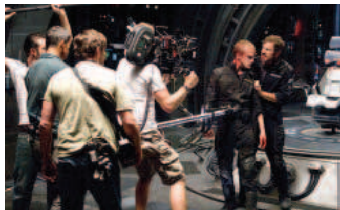
FÍOR 4.10 Mise-en-scène i gcomhair PANDORUM, 2009

Is frása Fraincise é mise-en-scène a úsáidtear i gcúrsaí amharclannaíochta. D'fhéadfaí é a aistriú mar 'an radharc a chur i láthair', ach anois ciallaíonn sé gach a dtéann sa radharc atá le scannánú – na seiteanna, na fearais, na haisteoirí, na feistis agus an soilsiú san áireamh. Cuimsíonn sé fiú suíomh agus gluaiseacht na n-aisteoirí, rud ar a dtugtar grúpáil. Tá ciall leathan leis an téarma mise-en-scène . Tugann sé le chéile na codanna físeacha uile a mbaineann dearthóirí agus stiúrthóirí úsáid astu chun an radharc a chruthú. Is féidir leas a bhaint as chun mothú agus atmaisféar a chruthú i scannán. Mar shampla, d'fhéadfadh an stiúrthóir mise-en-scène a úsáid chun leidí a thabhairt dúinn faoi na carachtair sa scannán. Má fheicimid árasán gioblach míshlachtmhar nó oifig shlachtmhar néata ar an scáileán bíimid ag súil le cineál ar leith duine a fheiceáil (fíor 4.10).