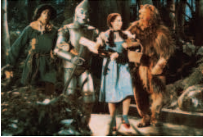
Fíor 4.16 Radharc as THE WIZARD OF OZ, 1939, scannán daite luath

am agus áit. Uaireanta méadaíonn nó leasaíonn an stiúrthóir an dath i radharc nó i scannán iomlán chun atmaisféar ar leith a chruthú (fíor 4.16).