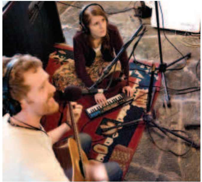
Fíor 4.24 Radharc ón scannán ONCE, 2006. Bhuaigh téamamhrán an scannáin 'Falling Slowly' Oscar as an Amhrán Nuachumtha ab Fhearr in 2007.

An bunábhar a dhéanann an criú ceamara agus an criú fuaim a thaifeadadh, ní mór é ar fad a chur le chéile agus a chur in eagar chun scannán iomlán a dhéanamh de. Is minic a dhéantar na radhairc a scannánú as ord. Féachann an t-eagarthóir agus an stiúrthóir go grinn ar an mbunábhar gach lá agus cuirtear tús leis an eagarthóireacht agus scannánaíocht fós ar siúl. In amanna, ní bhíonn a fhios acu conas mar a thiocfaidh na radhairc ar fad le chéile mar scannán go dtí go gcríochnaítear an scannánú go léir. Bíonn an t-eagarthóir agus an stiúrthóir ag obair as láimh a chéile chun radhairc a dhéanamh de sheatanna. Deimhníonn siad go bhfuil na sonraí teicniúla ar fad i gceart agus go bhfuil leanúnachas ann maidir leis an soilsiú agus na dathanna. Deimhníonn siad go bhfuil caighdeán na haisteoireachta sásúil freisin. Ní mór d'eagarthóir a bheith cruthaitheach agus aird a thabhairt ar dheiseanna nó ar rudaí a dhéanann aisteoirí go nádúrtha a chuirfeadh feabhas ar an scéal. Déantar leagan an eagarthóra chun a chinntiú go bhfuil snáithe an scéil ag teacht le chéile. Breathnaíonn an t-eagarthóir agus an stiúrthóir air go grinn chun lochtanna a aithint