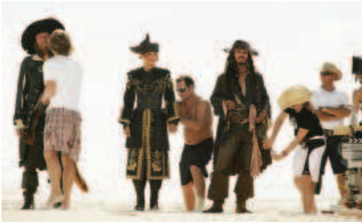
FÍOR 4.21 Feistis á gcóiriú i gcomhair PIRATES OF THE CARIBBEAN: AT WORLD'S END

freisin go mbaintear na seiteanna as a chéile agus go ndéantar na suíomhanna a ghlanadh nuair a bhíonn an scannánaíocht críochnaithe.