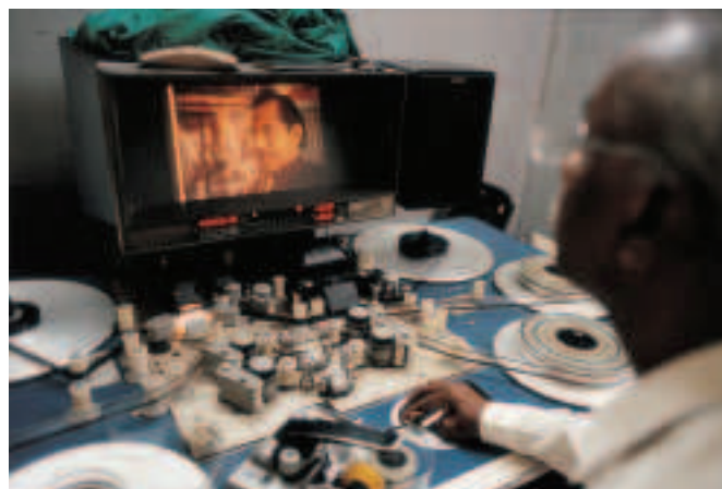
FÍOR 4.4 Úsáidtear deasc eagarthóir scannáin chun fuaim agus fis a mheascadh. Is féidir míreanna ó spóil éagsúla scannáin a thaifeadadh agus a sheinm in aon ord is mian leis an eagarthóir.

Is le linn na heagarthóireachta a chuirtear seatanna éagsúla le chéile i sraitheog. Is ról cruthaitheach a bhíonn ag an eagarthóir mar go mbíonn sé ag obair le híomhánna, leis an scéal, an ceol, an rithim agus an luas. Bíonn baint ag an eagarthóir le gnéithe den aisteoireacht fiú. Tá an iliomad féidearthachtaí ar fáil don eagarthóir. Is féidir leis sleachta beaga fuaime agus íomhánna a thógáil agus sraith iomlán chomhtháite a dhéanamh díobh. I dtús ama, ghearraí an scannán féin agus cheanglaítí arís é le meaisín eagarthóireachta. Bhí an t-eagarthóir ábalta dearbhchló den bhunscannán a fheiceáil ar an meaisín eagarthóireachta chomh maith, agus d'fhéadfaí athruithe trialacha a dhéanamh ar an dhearbhló gan damáiste a dhéanamh don chlaonchló (fíor 4.4).