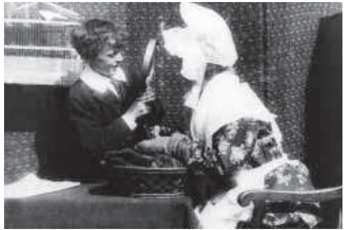
Fíor 4.13 Radharc as GRANDMA'S READING GLASSES le George Albert Smith, 1900. Nuair a fhéachann an páiste trí an ngloine formhéadúcháin, tá gearradh ann agus feictear seat teann dá bhfuil á bhreathnú aige.

Is minic a úsáidtear an seat fada chun an radharc nó an scéal a chur i gcomhthéacs don lucht féachana. Seat meánfhada a thugtar ar radharc ina bhfeictear na haisteoirí ón bhásta aníos nó ina bhfuil an meánionad i bhfócas. Tháinig an lionsa zúmála ar an saol sna 1930idí go luath i ré na fuaimne. Baintear úsáid as zúmáil chun díriú ar mhionghné i radharc nó chun tarraingt