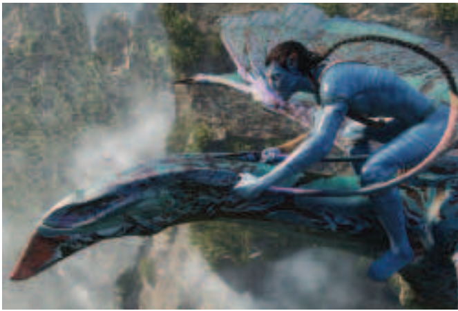
Fíor 4.5 Eifeachtaí ríomhghinte in AVATAR, 2009

Cuirtear tús leis an eagarthóireacht chomh luath is a thosaítear ar an scannánaíocht. Féachann an t-eagarthóir agus an stiúrthóir ar na seatanna a dhéantar gach lá agus pléann siad an chaoi a gcuirfead le chéile iad. Nuair a bhíonn an scannánú críochnaithe déantar leagan an eagarthóra , arb ionann é agus an chéad dréacht den scannán. Ansin déanann an stiúrthóir agus an t-eagarthóir an scannán a bhreathnú go grinn go bhfeicfidís an bhfuil bearnaí sa phlota, nó seatanna ar iarraidh, nó an gá míreanna faoi leith a scannánú an athuair. Ansin déanann siad leagan an stiúrthóra . Is é sin an leagan a thaispeántar do na léiritheoirí agus do pháirtithe leasmhara eile sula ndéantar an leagan deiridh .