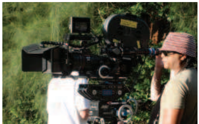
Fíor 4.2 Úsáidtear ceamaraí den chineál seo i scannánaíocht an lae inniu.

Sin é mar a bhí go dtí deireadh ré na mbalbhscannán. Nuair a cuireadh fuaim leis an scannán (tugadh ' talkies ' ar scannáin a raibh fuaim leo), bhí gá le luas níos tapúla de 24 fráma sa soicind. Is é sin an gnáthluas fós nuair a bhítear ag scannánú agus ag teilgean scannán. Déantar an fuaimrian a thaifeadadh ar an scannán ag an am céanna. Is é an córas ceannann céanna