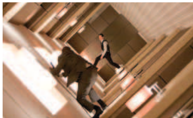
FÍOR 4.11 Íomhá fhrámáilte as INCEPTION, 2010

Cuid mhaith de na fadhbanna aeistéitice agus na rialacha a bhaineann le saothar ealaíne a fhrámáil agus a cheapadh, baineann siad le seat scannáin á fhrámáil freisin. Déanann an stiúrthóir agus an scannánóir plean den áit a mbeidh na pointí fócasacha agus den tslí a ngluaisfidh an ceamara nó na haisteoirí tríd an radharc. Is féidir clár an scéil a úsáid chun ceapadh na seatanna a phleanáil (fíor 4.11).