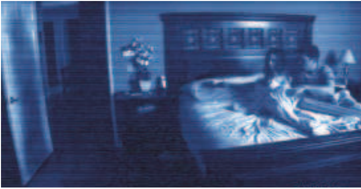
FÍOR 4.25 Ba léiriúchán mionbhuiséid a bhí in PARANORMAL ACTIVITY (2007).

agus á mhaolú arís. Tosaíonn an cumadóir ag obair go luath sa tréimhse réamhléiriúcháin. Bailíonn sé cóiritheoirí ceolfhoirne, cóipeálaithe agus ríomhchláraitheoirí ceoil le chéile. Stiúran sé gach cuid den phróiseas ceoil trí chéim na scannánaíochta agus na heagarthóireachta, go dtí an meascadh deiridh. Bíonn an cumadóir agus an stiúrthóir i láthair ag babhtáí féachana ina ndéanann siad nótaí de na háiteanna ina mbeidh ceol áirithe nó a n-athróidh an ceol. Roghnaíonn an cumadóir stíl le haghaidh an scannáin agus socraíonn sé ar théama agus ar chuspóir an cheoil sa scannán. Oibríonn sé leis an eagarthóir chun íomhánna agus fuaim a mheaitseáil agus cinntíonn sé go n-athraíonn na radhairc isteach ina chéile go deas réidh (fíor 4.24).