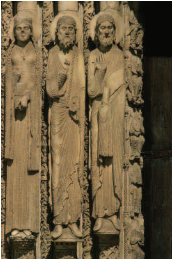
FÍOR 15.2 Dealbha colúin, Chartres