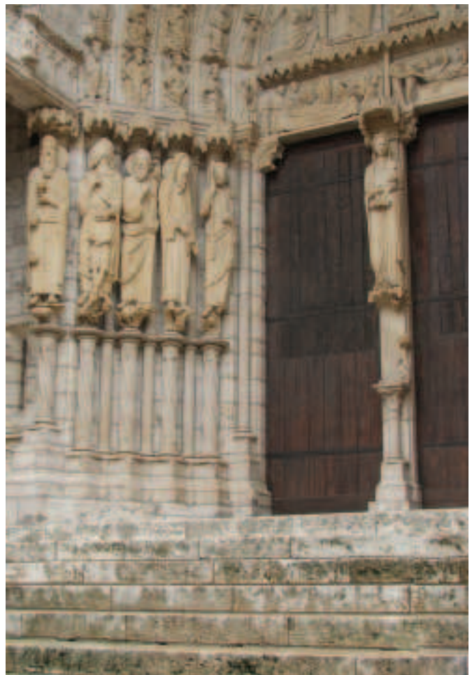
Fíor 15.6 Naomh Áine

Tá cailís á hiompar ag ardsagart an tSean-Tiomna, Meilcizidic, agus thall uaidh ar an taobh eile feictear Naomh Peadar, comharba Íosa. Bhí Abrahám, patrarc an tSean-Tiomna, sásta Íosac, a aonmhac féin a íobairt ar son Dé. Tuigeann sé go bhfuil íobairt Íosa le teacht agus seasann sé ag amharc ar Eoin Baiste, a thaispeánann Uan Dé dó.