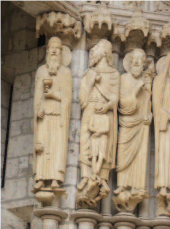
FÍOR 15.7 Abrahám agus Íosác