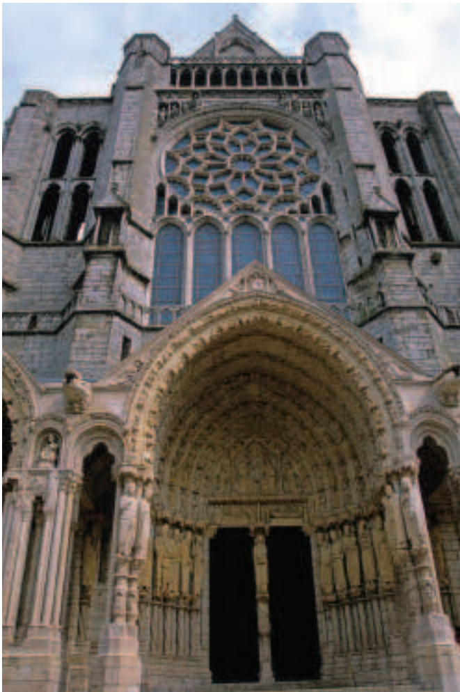
Fíor 15.5 An Doras Thuaidh, Chartres

Deirtear gur ríthe agus bannríona iad na dealbha ar dhá thaobh an dorais, agus is astusan a ainmníodh é. Níl duine ar bith cinnte cé hiad féin, ach is dócha go seasann siad do ríthe agus bhanríona Iúdáia, sinsir ríoga Íosa de réir an tSean-Tiomna. Tá stíl na ndealbheacha arda colúin seo ag teacht beagán leis an stíl Rómhánúil, ach tá dul chun cinn déanta sa mhéid is gur dlúthchuid anois iad de dhearadh iomlán an dorais. Tá siad in oiriúint don ailtireacht agus ag cur léi, seachas rud éigin sa bhreis a cuireadh leis an bhfoirgneamh.