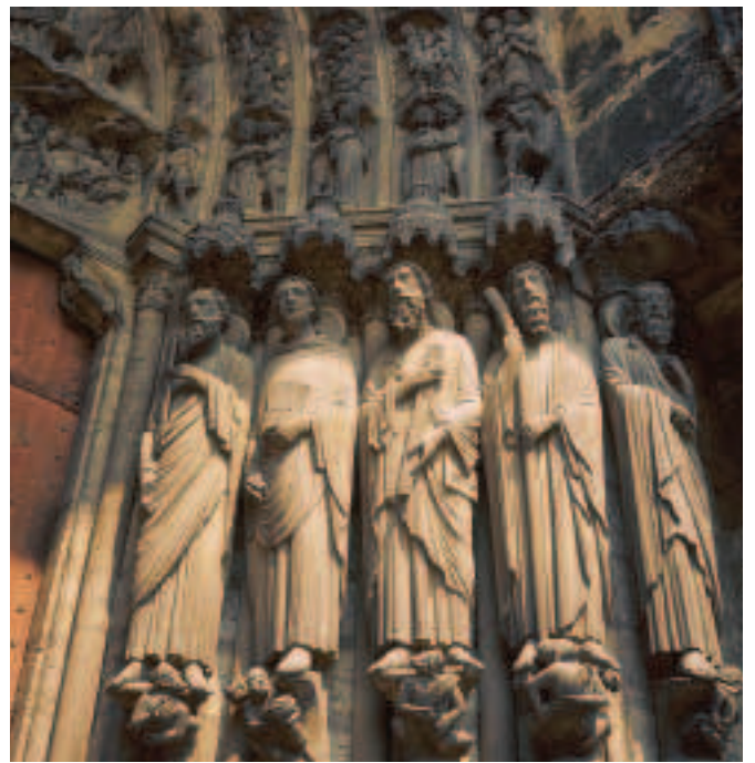
FÍOR 15.12 Naomh Eoin

Sa tiompán os cionn an dorais láir, léirítear radharc den Bheithiúnas Deireanach, bunaithe ar Shoiscéal Naomh Matha. Tá na híomhanna aithnidiúla uile le feiceáil ann – na hanamacha á meá ag Micheál agus na diabhail ag troid chun breith orthu. Cé go stiúraíonn na deamhain an dream damnaithe i dtreo