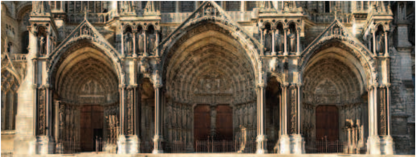
Fíor 15.9 An Doras Theas, Chartres

chumhracht agus ar gheanmnaíocht an mhaighdeanais. Tá a cuid gruaige scaoilte ag an mbean óg agus caitheann sí caille á clúdach. Tá leabhar i lámh amháin aici. Síneann sí an lámh eile amach faoina brat, muid á mbeannú aici agus a héadan á hiompú aici inár dtreo ar bhealach mánla séimh.