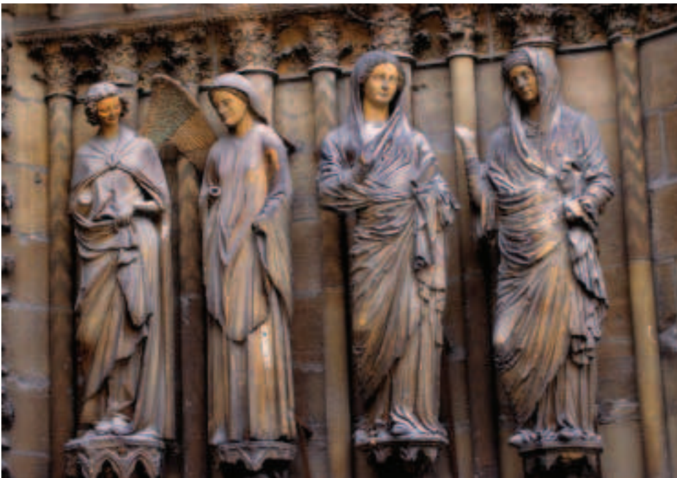
FÍOR 15.13 Teachtaireacht an Aingil, Ardeaglais Rheims

Bhí an deabhóid do Mhuire coitianta i measc an phobail sa 13ú haois. Bhí Ré an Niachais i réim, agus bhí an onóir is an grá cuirtéiseach ina mbuanna agus ina n-idéalacha ag an bpobal. Bhí ardmheas ar na mná riachtanach i gcód iompraíochta na ridirí, agus ba do Mhuire féin a tugadh an urraim ab airde.