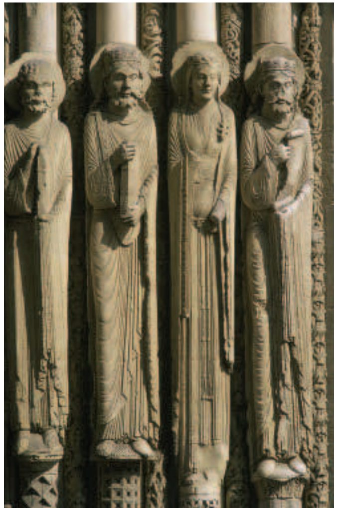
Fíor 15.1 Dealbha colúin, Chartres

dealbha colúin na ríthe agus na mbanríon. Cruthaíodh a leithéid ar dtús timpeall ar dhoras tosaigh Saint Denis agus is dócha gur bhain na dealbha úd le teaghlach ríoga na Fraince. Go luath ina dhiaidh sin, snoíodh a leithéid ar aghaidh thiar Chartres, agus níorbh fhada go raibh siad le fáil ar fud an Íle de France.