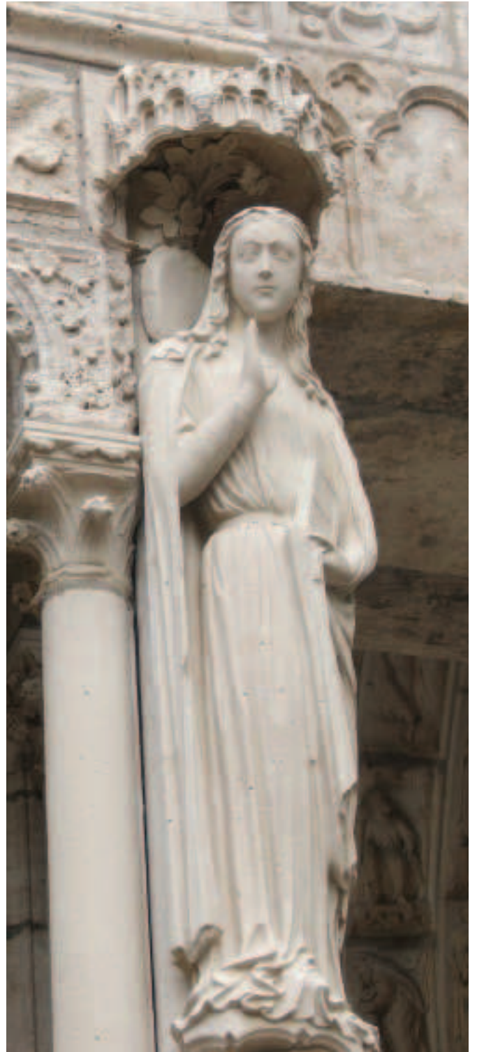
FÍOR 15.8 Naomh Modeste

Iníon le gobharnóir Chartres le linn ré na Róimhe ba ea Modesta. Bhí a hathair ar deargbhuile nuair a thiontaigh sí ina Críostaí tar éis di éisteacht leis an soiscéaláí Potentialius. Deirtear faoi Potentialius gur Naomh Peadar féin a chuir go Chartres é. D'impigh Modesta ar a hathair gan Potentialius a chur chun báis nuair a chuir sé ar a thriail é. Ach martraíodh