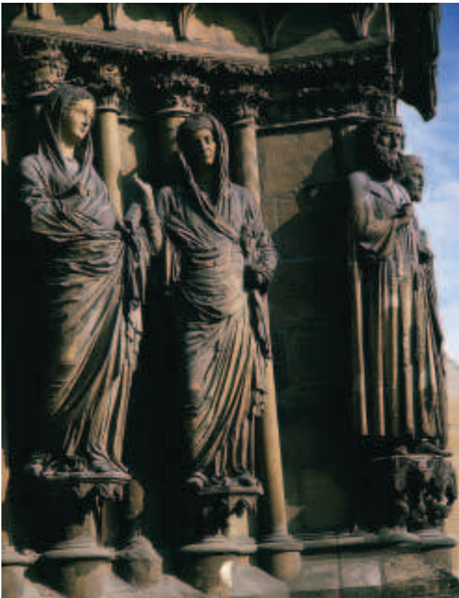
Fíor 15.14 An Mhaidhean Mhuire agus Eiliosaibeit, Ardeaglais Rheims

Tiomnaíodh iliomad ardeaglaisí don Mhaidhean, agus feictear a híomhá ag Rheims i mbinn na heaglaise os cionn an dorais láir, is a Mac á coróiniú mar Bhanríon ar na Flaithis. Feictear arís í ar phiara láir an phríomhdhorais ag cur fáilte roimh an bpobal. I measc na ndealbha mórthimpeall uirthi, léirítear Teachtaireacht an Aingil agus Cuairt Mhuire ar Eiliosaibeit.