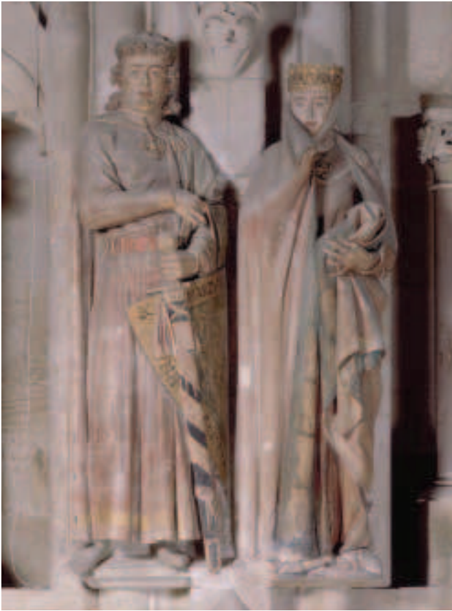
FÍOR 15.16 Ekkehard agus Uta

Maireann go leor de na dathanna geala bunaidh ar an dá dheilbh agus deirtear go raibh tionchar ag deilbh Uta, faoina caille agus a coróin, ar Walt Disney nuair a bhí banríona na gcartún á gcruthú aige.