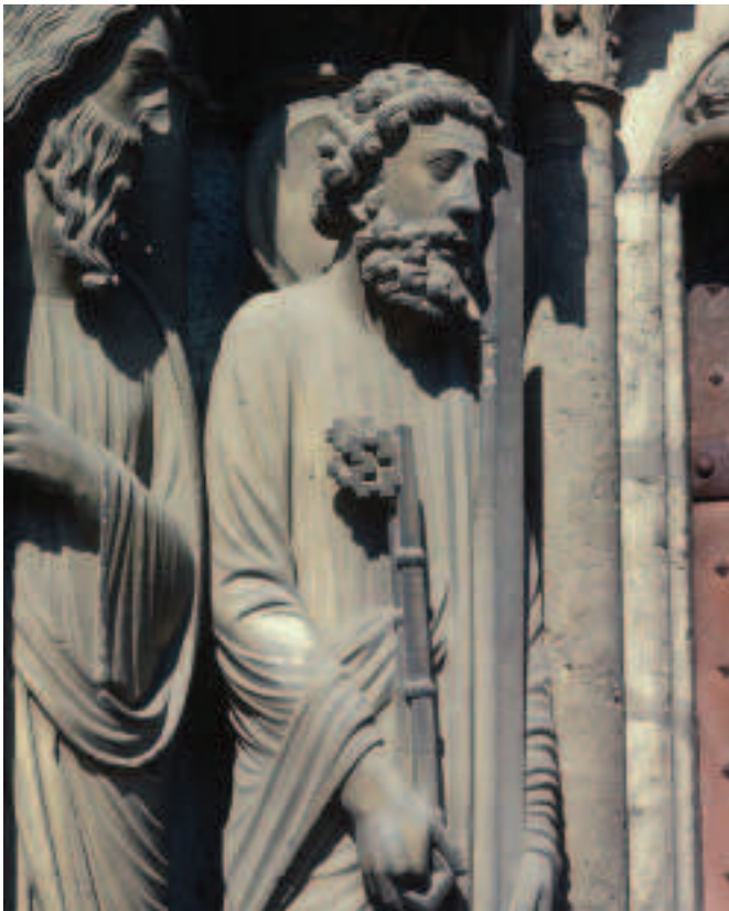
FÍOR 15.11 Naomh Peadar