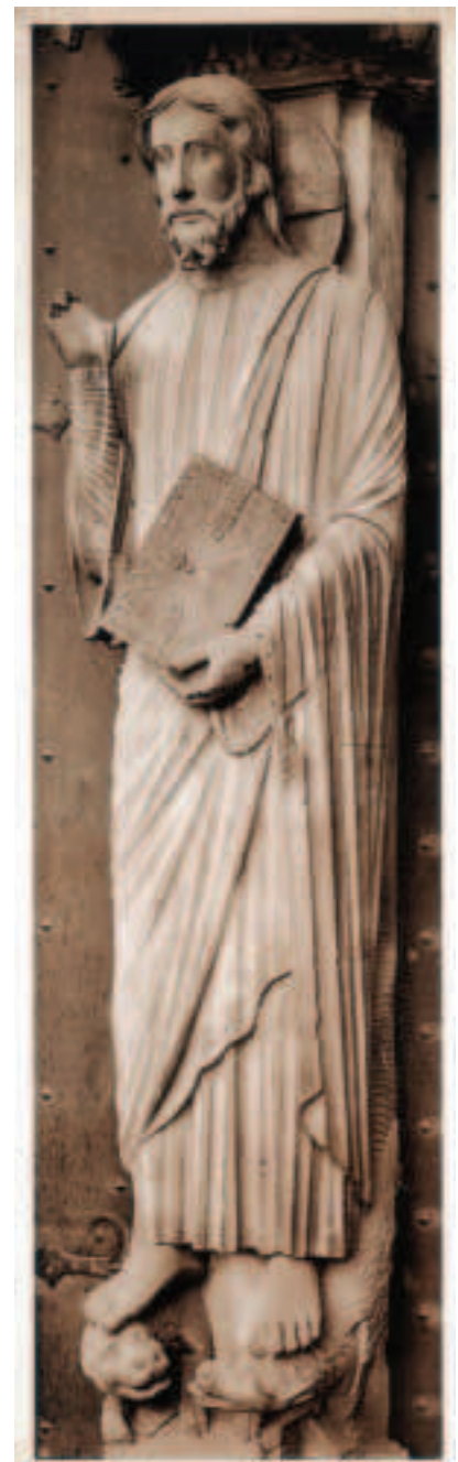
Fíor 15.10 Beannacht Íosa Críost

Ar an dá thaobh den doras, seasann an dáréag cosnocht ar cholúin áille chasta. Seasann Naomh Peadar (fíor 15.11) ar dheis Chríost mar cheann na heaglaise, is féidir é a aithint as a ghruaig agus a fhéasóg chatach. Tá eochair á hiompar aige, comhartha a chuid cumhachta ar an saol seo. I ngar dó, tá a chros á hiompar ag Naomh Aindrias agus iompraíonn Naomh Eoin, ógánach gan féasóg fós, a leabhar. Ní bhaineann aon siombail ar leith leis na haspail eile; ina ionad sin, iompraíonn siad gléasanna a mbáis, agus feictear fúthu deilbhreacha corónaithe Impireacht na Róimhe a rinne géarleanúint orthu.