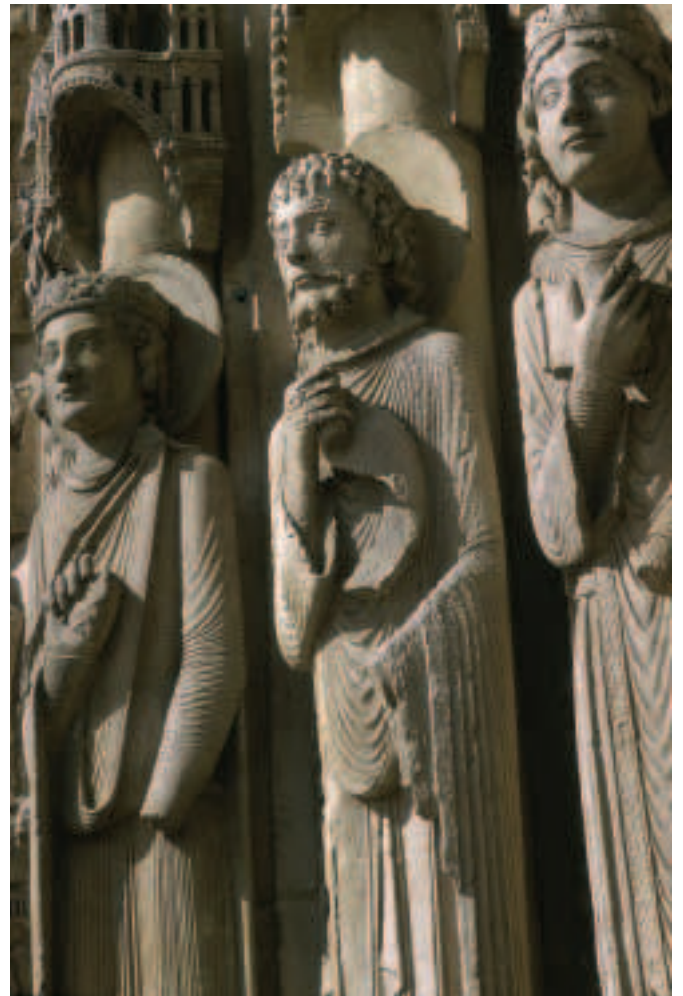
FÍOR 15.3 Dealbha colúin, Chartres

Scríosadh deilbheacha Saint Denis le linn Réabhlóid na Fraince, ach tá tuairim againn cén chuma a bhí orthu, a bhúí le píosaf líníochta a nhaireann fós. Tá grúpa an-chosúil leo le feiceáil i Chartres (fíor 15.1, fíor 15.2 agus fíor 15.3).