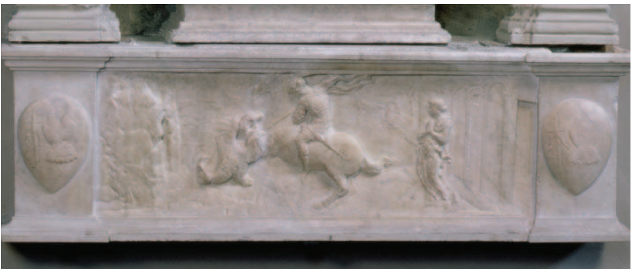
FÍOR 21.1 Naomh Seoirse agus an Dragan, seastán Naomh Seoirse, Donatello, Músaem Bargello, Flórans.

Ní foláir nó gur chuir cur chuige Donatello iontas ar a chomhaimsirigh. Go dtí sin ní raibh aon taithí acu ach ar radhairc chaoine néata, ar nós Dícheannadh Eoin Baiste le