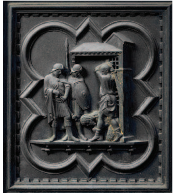
FIOR 21.3 DÍCHEANNADH EOIN BAISTE, Pisano, painéal ón doras theas, Baistealann Fhlórans

Andrea Pisano ar dhoras theas na baistealainne, radharc atá geall le bheith cineálta i gcomparáid le ceann Donatello (fíor 21.3).