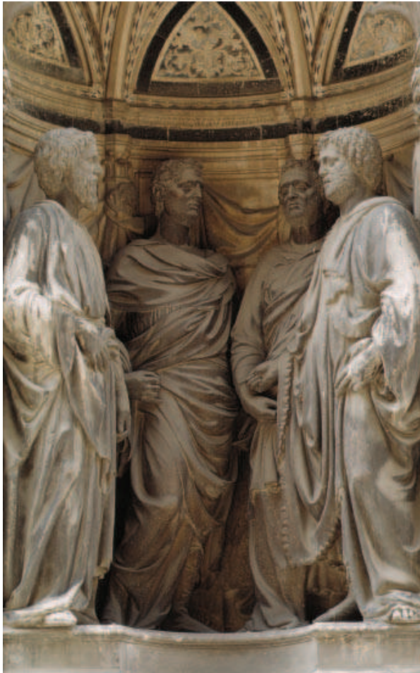
Flóir 22.2 AN CEATHRAR NAOMH CORÓNAITHE, Nanni di Banco, Orsanmichele, Flórans.