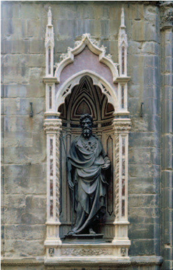
FÍOR 22.4 NAOMH EOIN BAISTE, Ghiberti, Orsanmichele, Flórans.