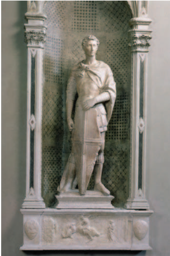
FÍOR 22.6 SAN SEOIRSE, Donatello, Orsanmichele, Flórans.

I Músaem Bargello i bhFlórans atá an dealbh mharmair féin. Tá cóip chré-umha di i bpóirse Orsanmichele. Tráth dá raibh bhí cláimh ina lámh agus clogad miotail ar a chloigeann ach is fada iad sin in easnamh.