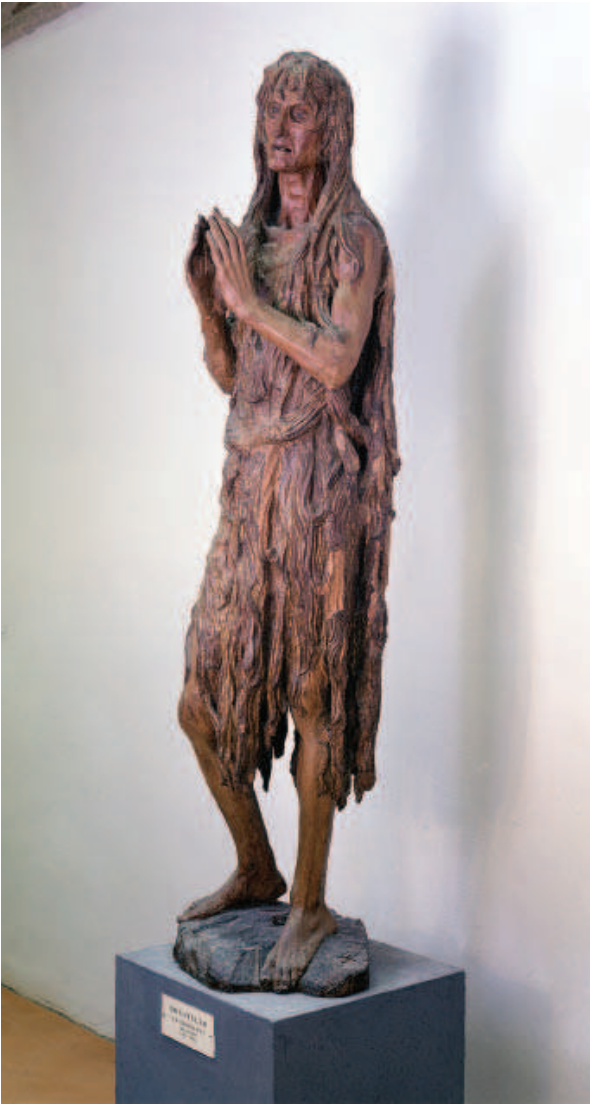
FIOR 22.8 MÁIRE MHAIGDILÉANA, Donatello, Museo del Opera del Duomo, Florans.

Seasann an striapach aithríoch agus glúin amháin lúbtha. Tá a cuid cos fada féitheach i riocht truacánta grástúil a mheabhraíonn dúinn a háilleacht agus í ina cailín óg. Tá a méara fada cnámhacha le chéile agus í ag guí, tá a cneas griandaite agus seirgthe ón troscadh. Ach tá i bhfad níos mó i sársaohar Donatello ná réalachas cliste. Tá an dealbh thruamhéalach beo le fuinneamh, é ag cúrsáil tríd an gcolainn go léir, rud a mhúsclaíonn comhbhá sa té atá ag amharc uirthi. Saohar bithbhuan é, samhail de phian shíoraí an chine dhaonna.