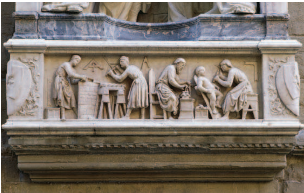
Flóir 22.3 Saoir ag saothrú leo, faoi bhun AN CEATHRAR NAOMH CORÓNAITHE.

Tar éis tamaill bhog Donatello go dtí saotharlann na hardeaglaise áit ar casadh Nanni de Banco air. I bpáirt le chéile a d'fhorbair siad beirt stíl nua de dhealbhóireacht shaorsheasaimh. D'oibrigh sé go dlúth le Filippo Brunelleschi freisin. Is uaidh sin a d'fhoghlaim sé rialacha an choibhnis agus na peirspeictíochta agus thug sé seal sa Róimh ina theannta ag déanamh staidéir ar na seandachtaí ann. Thar aon rud eile d'imir sé sin tionchar mór ar Dhonatello agus spreag é chun stíl ealaíne uathúil dá chuid féin a chruthú.