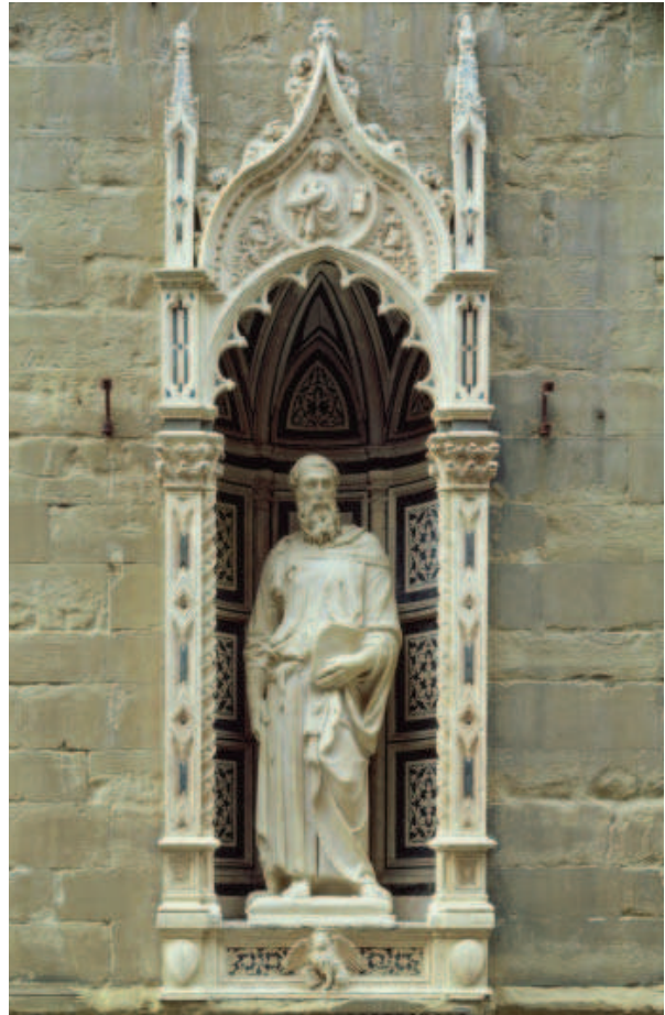
FÍOR 22.5 NAOMH MARCAS, Donatello, Orsanmichele, Flórans.

Os cionn a chaise deise a luíonn an chuid is mó de mheáchan an Naoimh. Sa treo eile ( in contrapposta ) atá an cholainn