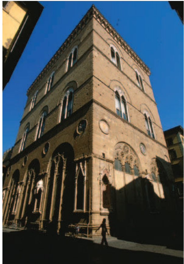
FÍOR 22.1 Séipéal Orsanmichele, Flórans.

Ba é Donatello a choimisiúnaigh cuallacht na n-oibrithe línéadaigh ar mhaithe le dealbh de Naomh Marcas a dhéanamh. Roghnaigh cuallacht na n-armadóirí é freisin chun an dealbh de Shan Seoirse a chruthú.