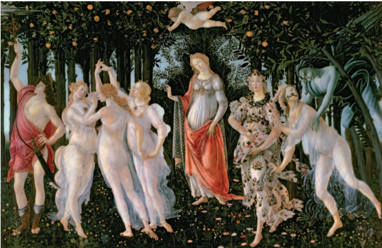
FÍOR 24.6 PRIMAVERA, Botticelli, Gailearaí Uffizi, Flórans

sula gclaochlaíonn sí ina Flóra atá ag scaipeadh pital roimpi amach. Os a gcionn in airde tá Cúipid (mac Véineas a bhfuil dallóg ar a shúile) ag scaoileadh saighde i dtreo na gcailíní atá ag damhsa leo i gcorcal síoraí an tsaol. Ar thaobh na lámhe clé ar fad, tá Mearcair (teachtaire na ndéithe) agus a shlat sínte in airde aige chun na néalta a cheileann an fhírinne a scuabadh chun siúil. Deirtear go bhfuil an phearsa sin an-chosúil le Giuliano, deartháir óg Lorenzo a dúnmharaíodh.