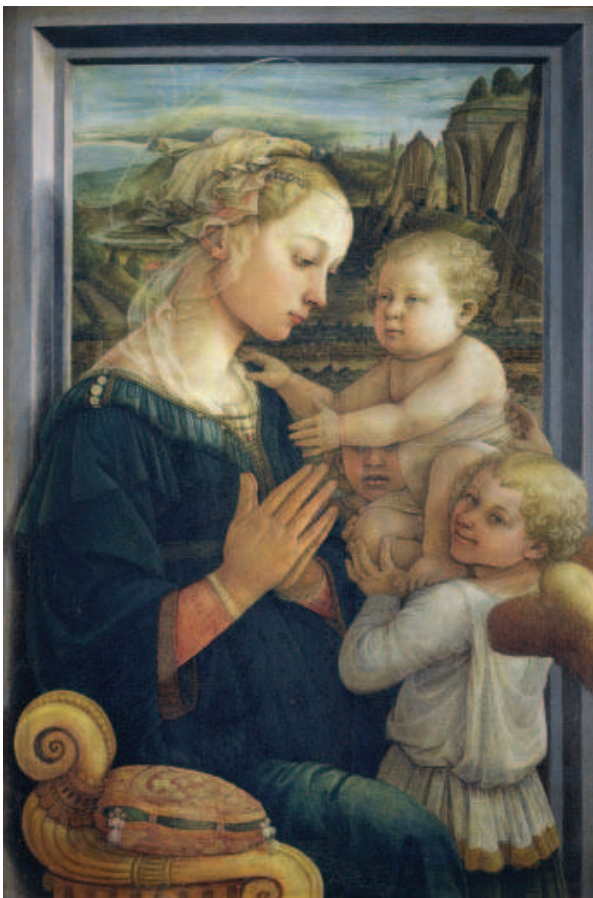
FÍOR 24.4 AN MHAIGHDEAN MHIURE AGUS A LEANBH, Fra Filippo Lippi, Gailearaí Uffizi, Flórans

Ghlac Lorenzo de' Medici agus a dheartháir óg, Giuliano, rialú Chathair Fhlórans orthu féin tar éis bhás a n-athar. Ní raibh Lorenzo ach 21 bliain d'aois ag an am. Bhí sé ina fhile agus ina phátrún fial ar lucht ealaíon, ach ba rialtóir dian é freisin, go háirithe tar éis gur sádh a dheartháir chun báis i gcomhcheilg chun na Medici a chur dá gcois.