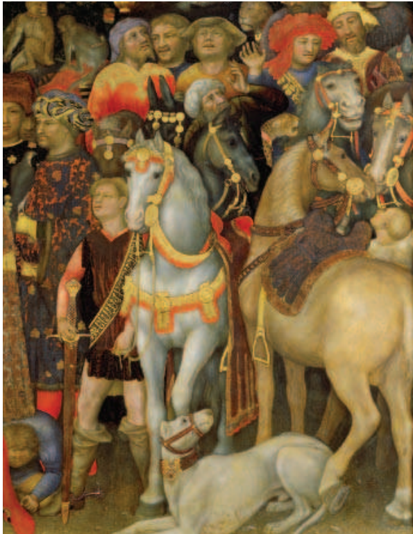
FÍOR 24.2 Sonra ó ÍOSA Á ADHRADH AG NA SAOITHE ANOIR, Gentile da Fabriano