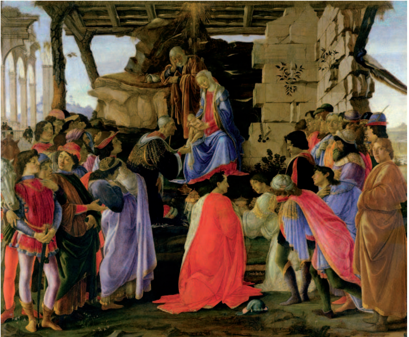
FÍOR 24.5 ÍOSA Á ADHRADH AG NA SAOITHE ANOIR, Botticelli, Gailearaí Uffizi, Flórans