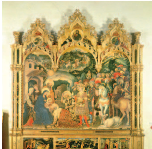
FÍOR 24.1 ÍOSA Á ADHRADH AG NA SAOITHE ANOIR, Gentile da Fabriano

Is léir ar na capaill bhreátha agus ar na héadaí galánta go bhfuil dúil ag an ealaíontóir sna mionsonraí. Tá an cúlra traidisiúnta Gotach ann, cúlra na n-órdhuillí. Feictear an spéir i bhfad i gcéin ar chúl na gcnoc, rud atá tipiciúil go maith. Ach tá áilleacht neamhghnách ag baint leis an bpictiúr, ina dhiaidh sin féin, agus úire sa chur chuige péinteála a fhágann gur saothar ar leith é.