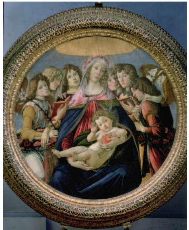
FÍOR 24.8 MAIGHDEAN NA POMAGRÁNAITE, Botticelli, Gailearaí Uffizi, Flórans

Cé gur fhan Botticelli ina dhlúthchara ag Lorenzo Ollásach tháinig sé faoi anáil sheanmóirí Savaranola, manach Doiminiceach a thug seanmóirí teasaí in éadan pháigánacht na Medici agus nósanna maireachtála phobal na cathrach. Ghabh ráig reiligiúin muintir na cathrach agus rinne siad tine chnámh dá mbaois agus dá mbaothánacht, tine inar dhóigh siad nithe luachmhara dá gcuid, mar a bhí molta ag Savaranola. D'éirigh Botticelli chomh buartha sin faoina raibh i ndán dá anam ar an saol eile gur chaith sé a lán dá phictiúir 'phágánacha' luatha sa tine. D'éirigh sé iontach diaga agus níor chaith sé a dhúthracht ach le pictiúir dhiaga amháin ina dhiaidh sin. Bhain cuid díobh sin le téamaí apacailipteacha sheanmóirí Savaranola. I ndeireadh báire dódh Savaranola ina eiriceach. Chaill Botticelli gnaoi a chuid pátrún agus fuair sé bás sa bhliain 1510 gan aird ag aon duine air.