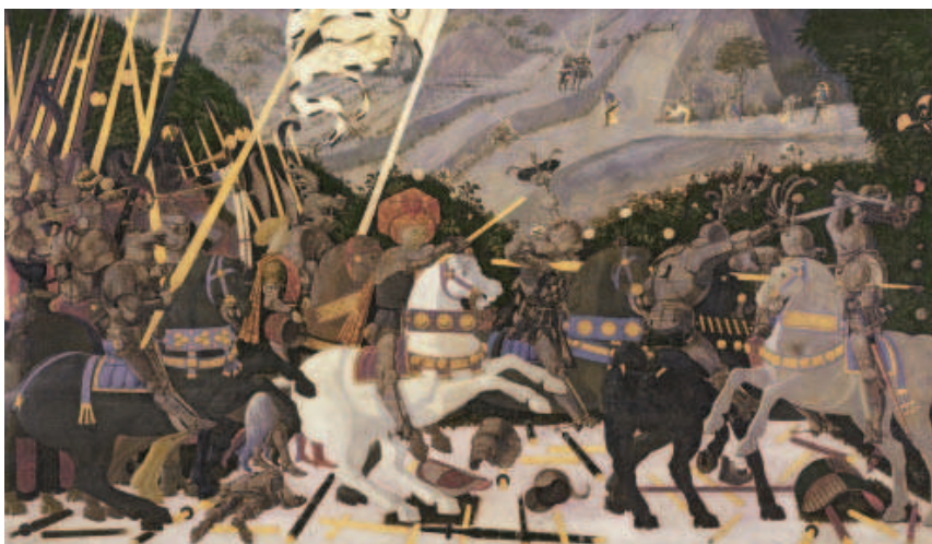
FÍOR 24.3 CATH SAN ROMANO An Ginearál Niccolò da Tolentino ag ceann fhórsaí Fhlórans, Paulo Uccello, An Dánlann Náisiúnta, Londain.

Is í an pheirspeictíocht líneach aonphointe atá i réim sa phictiúr, mar is léir ó réamhghiorrú na gcruthanna, ó na lansaí briste agus ó sheasamh agus ó choibhneas na gcapall. Seans gur theastaigh uaidh ardcéim réalachais a bhaint amach ach tá cuma righin adhmaid ar na fíoracha. Déarfá gur figiúirí