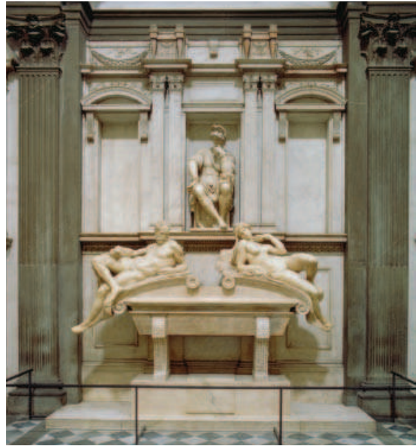
FIOR 27.8 Tuama Lorenzo de' Medici, Michelangelo, Sagrestia Nuova, San Lorenzo, Flórans