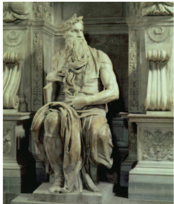
FÍOR 27.6 MOSÉ (Maois), Michelangelo, tuama an Phápa Lúil II, San Pietro in Vincola, An Róimh

I lár an tuama ar leibhéal na talún atá Maois suite inniu, ach bhí sé i gceist ar dtús go mbeadh an dealbh thuas ar airde agus go bhféachfaí aníos air. Ní foláir nó bhí sé i gceist go gcuirfeadh an dealbh chumhachtach cheannasach sin pearsantacht lúil féin i gciumhne don té d'fheicfeadh í, nó pearsantacht Michelangelo fiú. Is cinnte gur mhó a rachadh an dealbh i bhfeidhm ar dhaoine dá mbeadh sí ar airde mar a bhí i gceist go mbeadh.