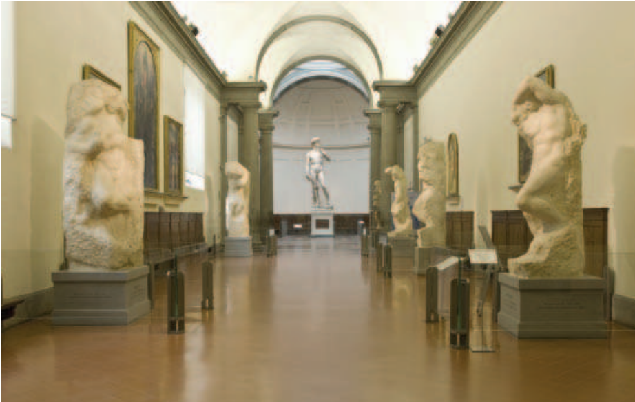
FÍOR 27.5 I PRIGIONI (Na Daoir), Michelangelo, Accademia, Flórans