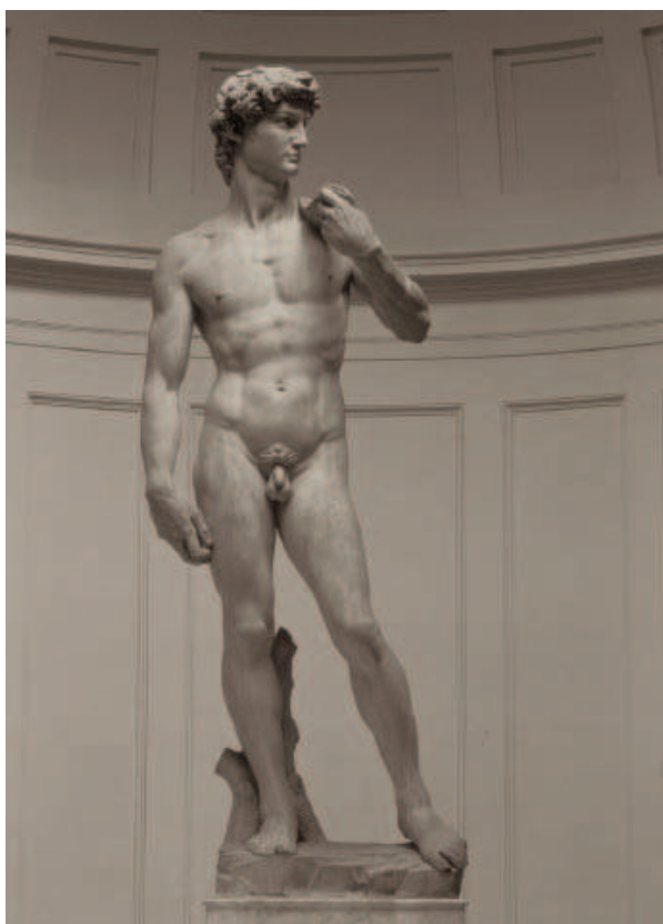
FÍOR 27.2 DAVID (Dáibhí), Michelangelo, Accademia, Flórans

an-srianta ar an modh clasaiceach. Léiríodh na fíoracha go réalaíoch, ach is fíoracha idéalaithe foirfe naofa iad seachas fíoracha daonna.