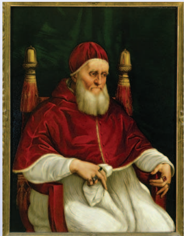
FÍOR 27.10 RITRATTO DI PAPA GIULIO II (Portráid den Phápa Iúil II), Rafael, Galleria degli Uffizi, Flórans

Cheap Iúil Donato Bramante mar phríomhailtire agus mar phleanálaí cathrach. Ní raibh ceachtar acu, an Pápa ná Bramante, róbhuartha faoi iarsmaí ón Ré Chlásaiceach sa Róimh agus baineadh leas as an bhFóram agus as an gColasaem mar fhoinsé cloch le haghaidh na tógála. Mar bharr air sin, scriosadh an foirgneamh ba chéimiúla ar sheanfhoirgnimh naofa na Róimhe chun Baisleach ollmhór Pheadair a thógáil as an nua. Ainneoin gur creideadh go raibh Naomh Peadar curtha faoin mbaisleach a thóg an chéad impire Críostaí, Constantine, sa bhliain AD 330, leagadh go talamh é in 1506. Ní haon ionadh go dtugtaí 'Bramante ruinante ' (leagthóir) ar an ailtire.