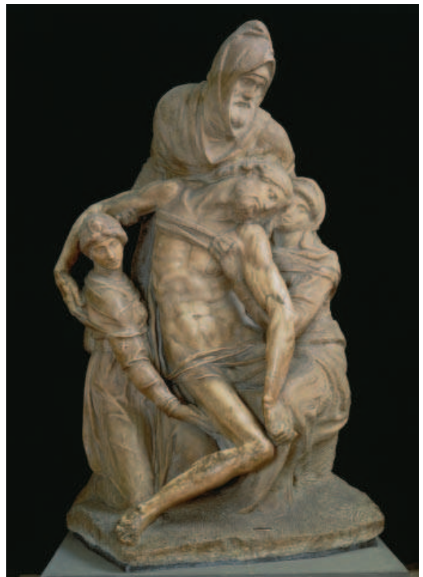
FIOR 27.9 PIETÀ FIORENTINA, (Pietà Flórans) Michelangelo, Museo dell'Opera del Duomo, Flórans

Feictear an Mhaighdean Mhuire agus an Leanbh Íosa le chéile arís agus arís eile i saothar Michelangelo. Tá creideamh láidir le sonrú go mór sna píosaí ealaíne leis. Sna pietàna deireanacha leis cuirtear téama na máthar agus an linbh i láthair go han-chumhachtach, agus go cráite fiú.