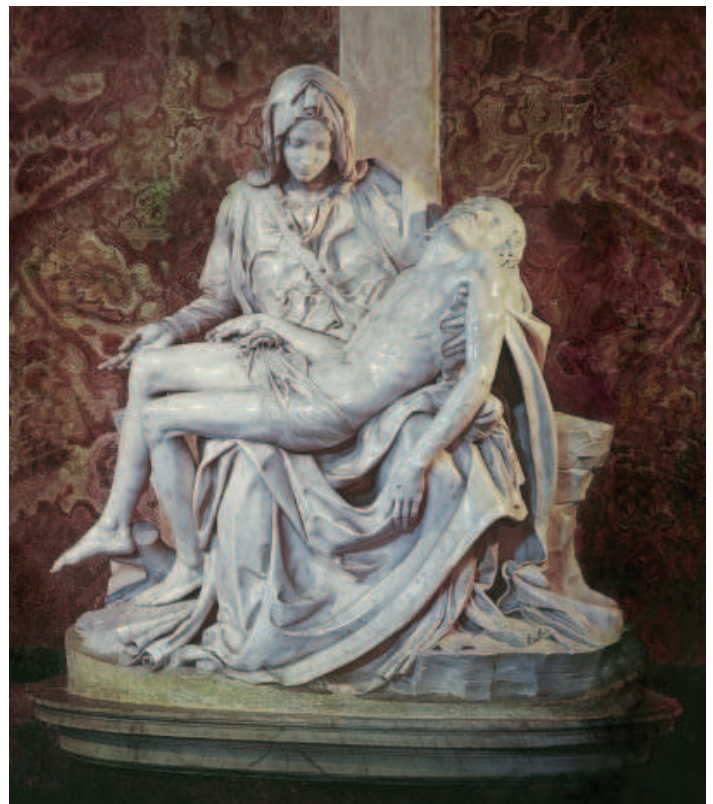
FÍOR 27.1 PIETÀ, Michelangelo, Baisleac Pheadair, An Róimh

Is é is ciall leis an bhfocal Iodáilise pietà ná trua, ach san ealaín dhiaga is éard is brí leis ná an Mhaighdean Mhuire ag caoineadh os cionn chorp Chríost. Bhí an téama sin níos coitianta in ealaín thuaisceart na hEorpa, ach chuaigh Michelangelo i ngleic leis agus rinne léiriú úrnua ar fad ar an téama agus gan é ach 23 bliain d'aois. D'fhill sé ar an téama sin arís i gcaitheamh na mblianta, ach is é an chéad Pietà (fíor 27.1) an ceann is áille, is uaisle agus is dea-chumtha, agus is é an t-aon saothar a shínigh sé. Féachann an Mhaighdean Mhuire síos agus cuma chiúin státúil uirthi in ainneoin a bróin. Cé go léiríonn an dealbh eachtra drámatúil, déantar é ar bhealach