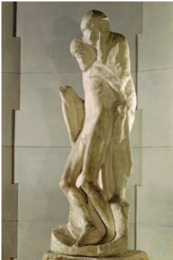
FÍOR 27.11 PIETÀ RONDANINI, Michelangelo, Castello Sforzesco, Milano

Cheapfá go bhfuil an mac ag tabhairt tacaíochta dá mháthair fiú tar éis a bháis. Ar an gcaoi sin, cuireann Michelangelo an nasc do-bhriste atá idir an mháthair agus a leanbh i gcomparáid leis an nasc idir an t-ealaíontóir agus a shaothar. Níl aon rian de léiriú srianta an mhodha chlasaicigh air a thuilleadh; níl fágtha ach na gnéithe is bunúsaí agus is geall le saothar nua-aoiseach é agus an dreach cráite teibí atá air.