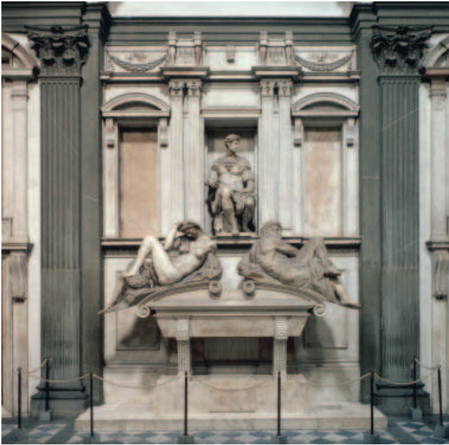
FIOR 27.7 Tuama Giuliano de' Medici, Michelangelo, Sagrestia Nuova, San Lorenzo, Flórans