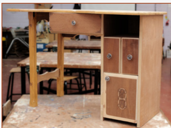
1.7 Deasc (Bliain 3)