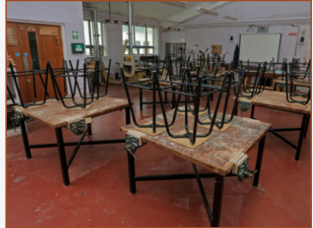
1.2 Binsí oibre

Is mór an difear idir an seomra teicneolaíocht ábhar adhmaid agus formhór na seomraí ranga eile sa scoil. Bíonn uirlisí agus trealamh ar leith ann nach mbíonn i ngnáthsheomra ranga. Sa teicneolaíocht ábhar adhmaid, bíonn an deis ag scoláirí scileanna nua a fhoghlaim agus úsáid a bhaint as uirlisí agus meaisíní ar bhealach cruthaitheach praiticiúil.