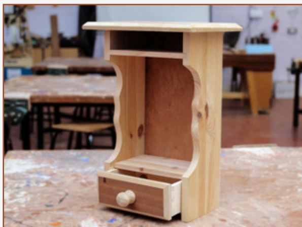
1.6 Bord cois leapa (Bliain 2)