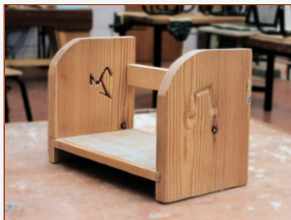
1.4 Seif leabhar (Bliain 1)