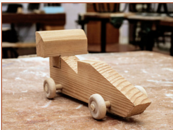
1.3 Carr adhmaid (Bliain 1)