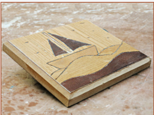
1.5 Bád (Bliain 2)