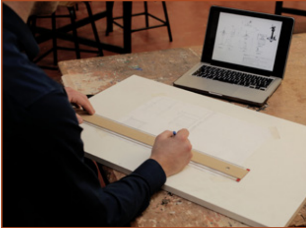
1.1 Clár Líníochta